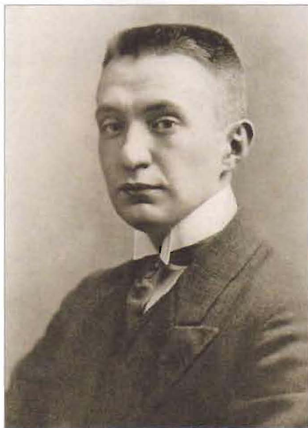
А. Ф. Керенский.

кий в силу своего премьерства в был наиболее известной фигу- таде. Отношение к нему в эми- ло в целом крайне недоброе: никто не любит проигравших, ности если есть возможность на неудачника ответственность нные бедствия, персонифици- скую революцию. Маклаков и относились к тем немногим лю- дые знали Керенского доволь- и умели различить за ставшим