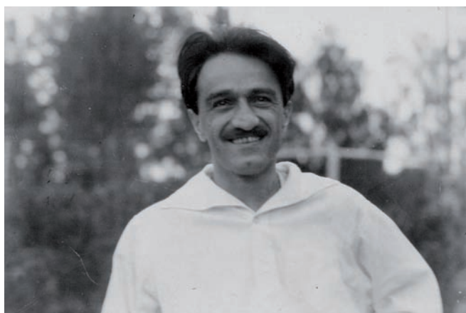
Рис. 3. Минуты без напряжения. 1932 (публикуется впервые)

Под конец мы узнаём, что верный ленинец был еще и превосходным семьянином.