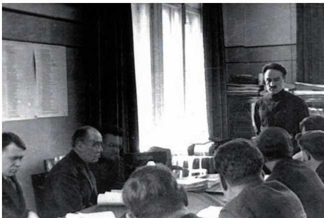
Рис. 9. «Сообщите, кто за это отвечает и кто нарушил мой приказ?» 1934 (публикуется впервые)

то придется. Это уже не просто борьба с грызунами, это политика!