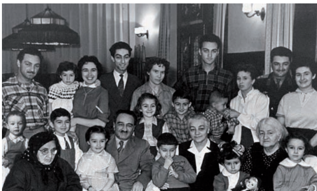
Рис. 4. Клан. 1963 (публикуется впервые)