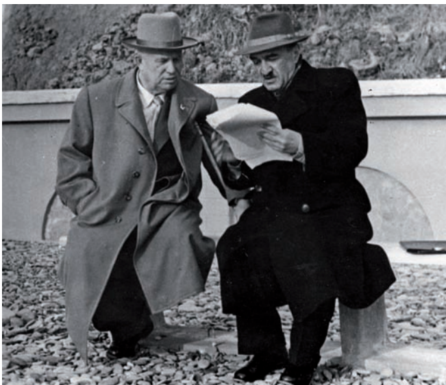
Рис. 2. Хрущев и Микоян в Пиццунде. 1963

была восхвалять Анастаса Ивановича, а подрастающие поколения — воспитываться на его примере.