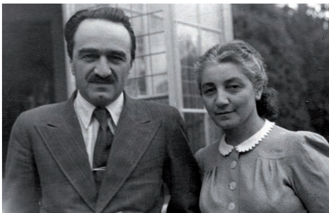
Рис. 6. Счастливая пара. 1939 (публикуется впервые)

тал своим учителем, был расстрелян вместе с другими героями Гражданской войны».