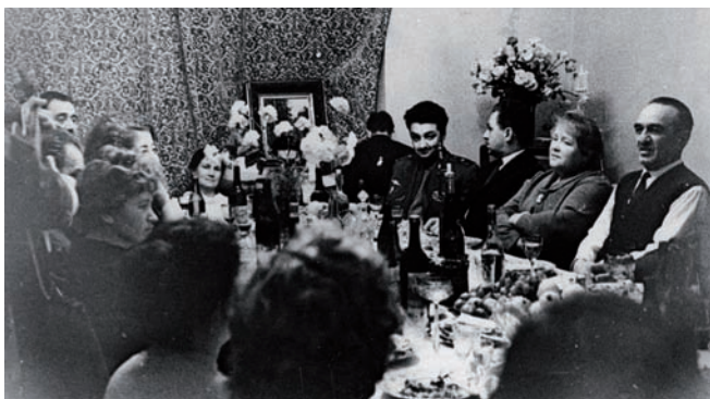
Рис. 5. «Стол, похожий на аэродромное поле». 1963 (публикуется впервые)