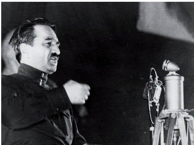
Рис. 7. «Нужно разбудить спящих!». Начало 1930-х

«Нужно только лучше руководить, нужно разбудить спящих, поощрить энергичных, оказать помощь там, где люди не могут выбраться сами, дать нашим работ-