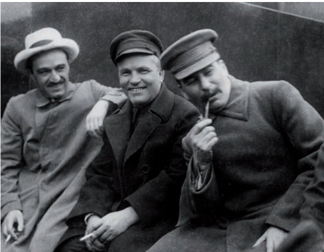
Рис. 1. Микоян, Киров и Сталин в 1933 году. Еще можно улыбаться (публикуется впервые)

Анастас Микоян вроде бы являлся частью той же команды. Но занимался не политикой, а промышлен-