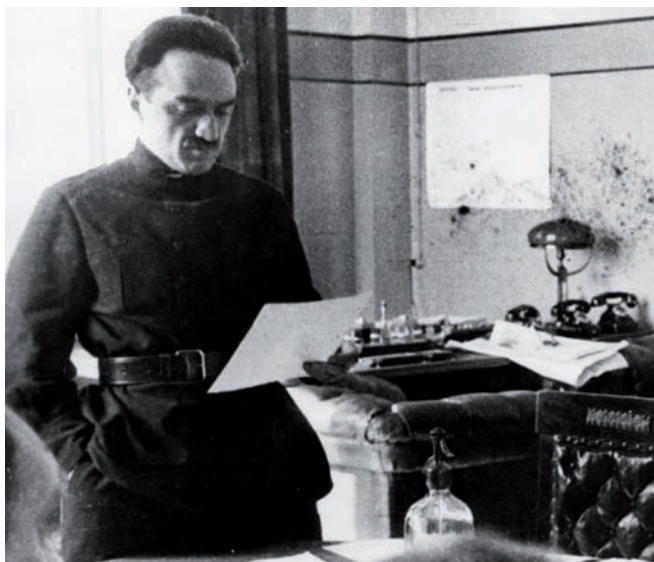
Рис. 8. «Никаких аргументов и причин я не знаю и знать не хочу!» Начало 1930-х

Показательно, что у людей, фигурирующих в документах, нет имен. Есть только фамилии. Это общий стиль 20-х и ранних 30-х годов, отражающий своеобразный эгалитаризм. Все равны. Уважительное обращение по имени и отчеству, характерное для русского дореволюционного общества, фактически упразднено, поскольку в нем есть элемент заискивания. А по имени обращаются друг к другу лишь друзья, близкие люди. Остальные просто товарищи. Кстати, судя по некоторым воспоминаниям, вождь народов тоже не любил, когда к нему обращались (как в официальных здравицах) «Иосиф Виссарионович». Он предпочитал привычное партийное обращение: «товарищ Сталин».