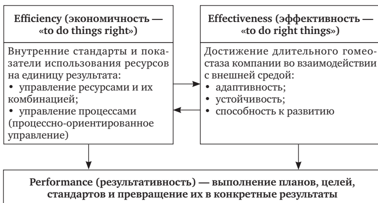
Рис. 1.1. Система результативности маркетинга: основные понятия

На рисунке 1.1 приведены основные понятия, формирующие систему результативности маркетинга: экономичность (efficiency) и эффективность (effectiveness), результативность маркетинга (marketing performance) 1 .