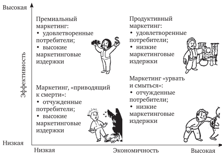
Рис. 1.3. Измерения продуктивности маркетинга по Дж. Шету и Р. Сисодии («effective efficiency» 1 )

Дж. Шет и Р. Сисодия [15] предлагают определять продуктивность маркетинга в соотношении двух измерений: 1) уровня удовлетворенности клиентов (эффективность), 2) уровня затрат на маркетинг (экономичность) (рис. 1.3).