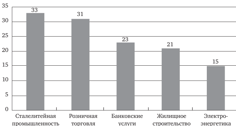
Рис. 1.2. Производительность труда в России относительно уровня США, %

Понятие экономичность, внутренняя эффективность (efficiency) определяется путем сравнения результатов и вызвавших этих результатов затрат. Данная категория характеризует меру использования тех или иных видов ресурсов или их совокупности. Экономичность использования традиционных видов ресурсов обычно характеризуется показателями фондоотдачи, производительности труда, материалоотдачи и др. Например, экономичность торгового центра можно оценить на основе показателя выручки с 1 м 2 торговой площади, количества сотрудников на 1 м 2 торговой площади. Эти показатели полезно сравнивать с аналогичными показателями конкурентов, среднеотраслевыми, наилучшими в отрасли. Один из ключевых показателей, характеризующих внутреннюю эффективность, или экономичность, — производительность труда. Производительность — это ключевой фактор конкурентоспособности экономики и стабильного экономического роста. Компания «МакКинзи» провела исследование в пяти секторах российской экономики: розничная торговля, сталелитейная промышленность, розничный банковский сектор, жилищное строительство и электроэнергетика. Цель данного исследования заключалась в измерении производительности труда в России по сравнению с другими странами и определении спектра необходимых действий по ее повышению.