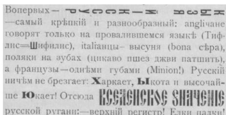
Ил. 1 (Терентьев 1920: 3)

Радикальнее всех в области типографики были поэты группы «41 градус». В «Трактате о сплошном неприличии» И. Терентьева различные начертания букв русского и других алфавитов буквально в каждой строке острают нормативный язык, карнавалено обыгрывая всякую языковую правильность, как в этом фрагменте о «русском языке», который «ничем не брезгает», и о «вселенском значении» «русской ругани» (ил. 1).