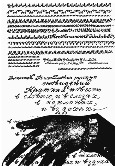
Ил. 2 (Мнацаканова 1980–1986)

В русскоязычную поэзию идея расщепления слова возвращается уже в неоавангарде в экспериментальном письме Е. Мнацакановой. Начиная с 1940-х годов она создает авторские книги-альбомы, в которых изобретаются новые способы совмещения графики и фоники. Причем если сами тексты сохраняют языковой субстрат (на основе кириллицы и латиницы), то оформления книг включают в себя внеязыковые опыты письменности на пограничье между чистой графикой и асемическим письмом 4 . Прорисовка отдельных букв образует репититивные рукописные графолалические серии, чередуясь со словесными рядами и абстрактными орнаментами в едином синтетическом вербально-визуальном письме (ил. 2, 3).