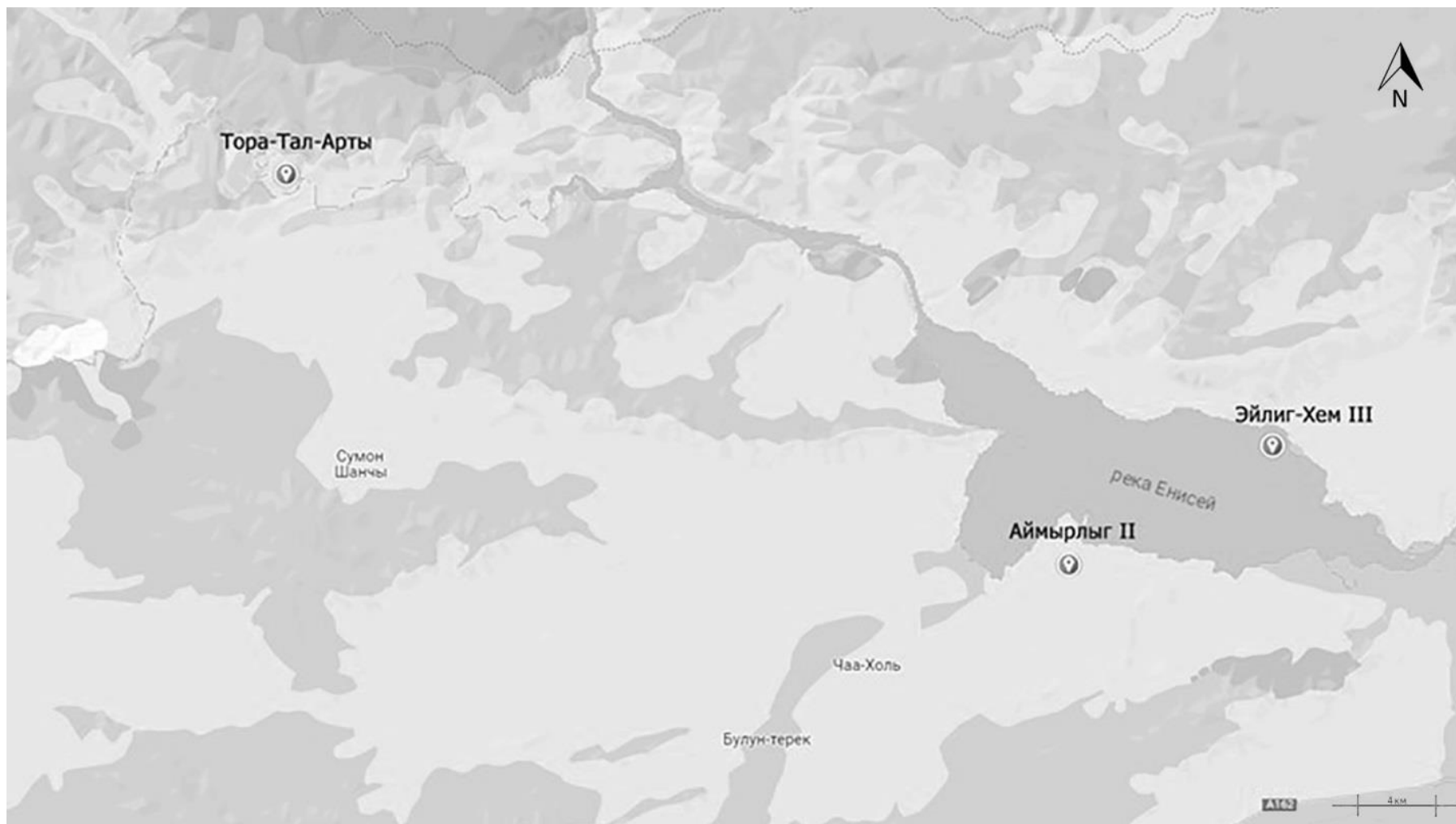
Рис. 1. Микрорегион Центральной Тувы и памятники Эйлиг-Хем III, Аймырлыг II и Тора-Тал-Арты 1