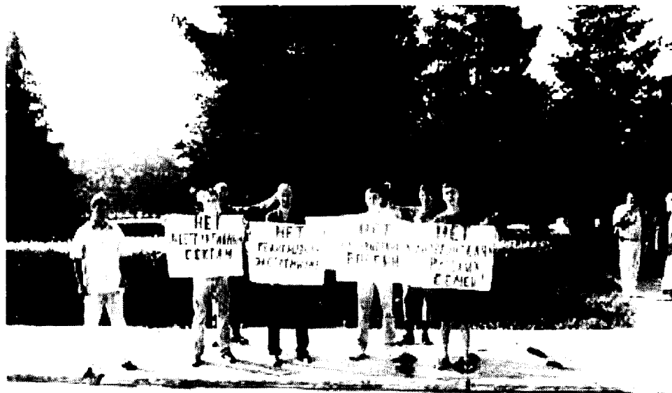
Пикет против сект и деструктивных культов в г. Хабаровске

либо вмешательства со стороны государства, чем граждан и само государство от деятельности данных организаций. Многие видные ученые-религиоведы заявляют о провале Федерального закона «О свободе совести и о религиозных объединениях» [16].