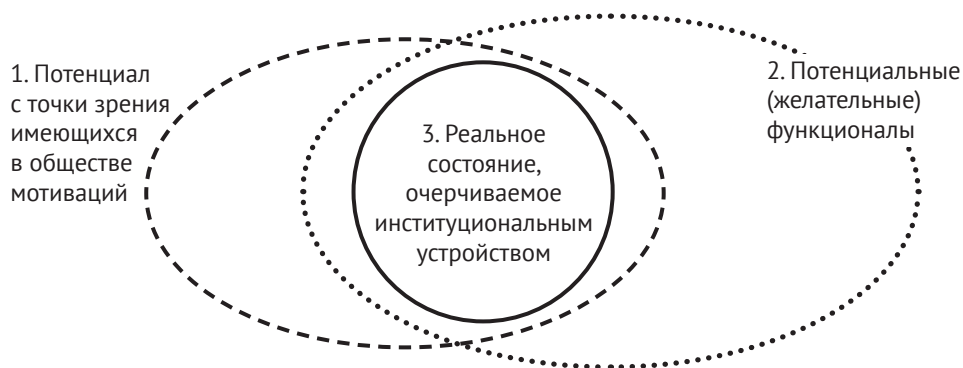
Рис. 1.1. Самоорганизация: мотивационный, функциональный и институциональный аспекты

Учет институциональных аспектов придает конкретность объяснениям того, почему третий сектор имеет те или иные масштабы, структуру, историю и перспективы развития. Именно институциональное устройство определяет те «русла», в которых практически реализуются альтруистические активности и некоммерчески мотивированная самоорганизация. Сказанное выше иллюстрируется рис. 1.1 и 1.2.