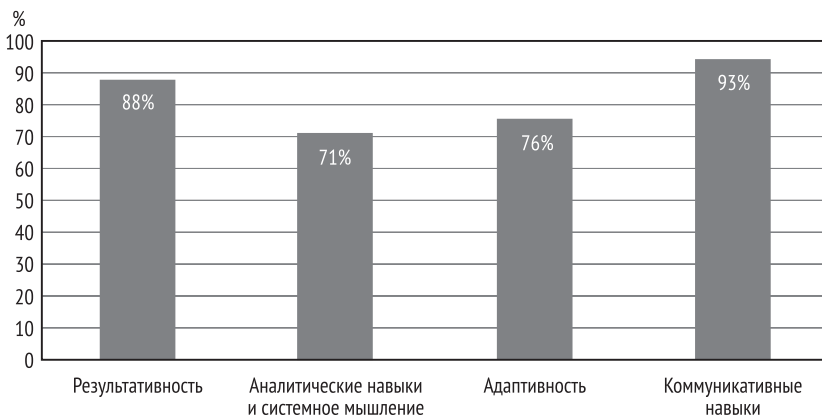
Рис. 3. Влияние практик самооценивания на развитие системных компетенций

Полученные данные свидетельствуют о том, что такие системные компетенции, как результативность и коммуникативные навыки, получили наибольшее развитие по итогам опытного обучения (рис. 4). Это объясняется тем, что в процессе самооценивания и взаимной обратной связи студенты могли более активно принимать участие в тех аспектах обучения, которые соответствовали их индивидуальным предпочтениям и интересам, что не могло не повлиять на интенсивность развития определенных навыков [11]. К тому же оценка за курс «Академическое письмо» зависела от качества выполнения заданий, что могло подчеркнуть важность достижения положительных результатов, особенно в контексте данного исследования.