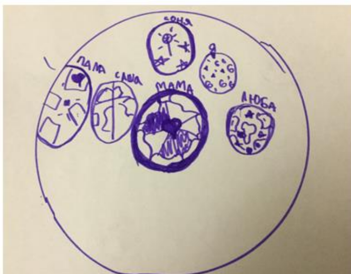
Рисунок 2. Пример социогаммы кровного ребенка из замещающей семьи.

Обобщая сравнительный анализ полученных рисунков, мы можем сказать, что все респонденты воспринимают приемного ребенка интегрированным в свою семью вне зависимости от своего к нему/к ним отношения. Приемные сиблинги для них не временное явление, а полноценный член семьи на всю жизнь, что дополнительно подтверждается в ответах на вопросы интервью. Родители для всех респондентов являются наиболее значимыми членами семьи, это подтверждает сделанные ранее выводы о том, что кровные дети доверяют родителям, опираются на их решения и выбор. На многих социогаммах отмечается относительно более высокий статус матери. Отец изображается либо рядом с ней, но несколько ниже или дальше от центра, либо (изредка) совсем на периферии.