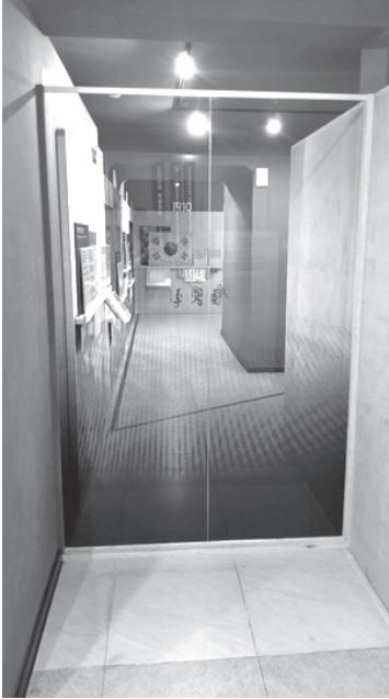
Figure 7: The glass partition at the entrance of the museum highlights to focus of the 1910 Korean Independence Movement and the Taegukki as the symbol of Korean nationalism.

formation of Korean kolkhozes , and the establishment of formalized relations between South Korea and the Soviet Union in 1990. Thus, the museum plays a different role – and holds distinct place-meaning – within the South Korean and Koryo saram overlapping narrative landscapes. The museum, and other designated sites, are highlighted as key places of remembering the Korean independence movement; yet the Koryo saram do not highlight or even recognize participation in the movement. Instead, above the museum in the ballroom is a place of celebration and nostalgia (weddings, reunions, and birthday parties).