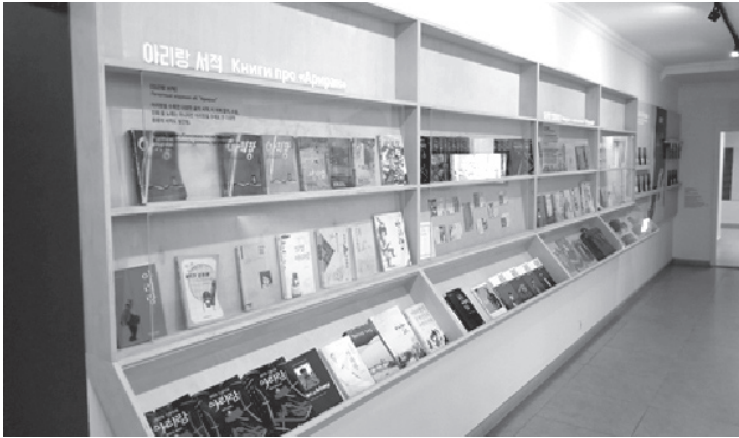
Figure 9: This wall within the Arirang room of the museum shows some of the expanse of memorabilia dedicated to South Korean books, comics, records, and materials named or titled ‘Arirang’.

“I have never been. Where is it?” This was the most common response to inquiries to local Koryo saram regarding the museum. Despite the majority of Koryo saram not having visited the museum, 25 a few who had shared valuable insights; one com-