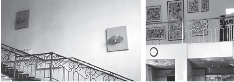
Figures 2 and 3: Interior of museum entry with Korean-style hand fan wall sconces(left) and Korean-style window dressing wall hangings (right). The museum entrance can be seen below in figure 3 (right) on the first level.

tour guides live up to their title in any respect, this is where explanation occurs, as they discuss the diasporization of the Koryo saram . Then the visitors funnel through the corridor flanked by a timeline of events and relevant artefacts, guided forward by the line on the floor and the march of time. Finally, the corridor opens, depositing the time travelers into a room of nostalgia and longing – a room fully dedicated to Arirang .