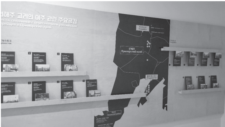
Figure 5: Within the museum is a vignette featuring other local Koryo saram heritage sites within the Russian Far East. These sites function as the nodal anchors in bounding the Soviet Korean narrative landscape.

is comprised of and affixed to places which serve as nodes of a specific past. These nodes serve as anchors to the spatial boundaries on the landscape, acting as a network frame of socio-cultural spheres of influence. Historically, stelae were often utilized as such nodal boundary markers to designate areas of influence. Monuments, memorials, and the museum are erected with the intent that they act as nodes at the center of socio-cultural bounded spaces. In the case of South Korea, the cultural claim and territorial expansion of hallyu (the so-termed 'Korean Wave' of culture) is delineated and demarcated by such nodes across the globe. Among local populations and tourist hubs restaurants with target-language menus and bus parking zones, as well as community centers and grocers serve as ethno-cultural stelae. The past decade of monument erection by South Korean government and private investment serves to designate cultural and ethnic boundary-making in the Russian Far East. Thus, processes of territorialization and place-making are enacted by tourists that broaden the socio-cultural stakes of the South Korean cultural sphere.