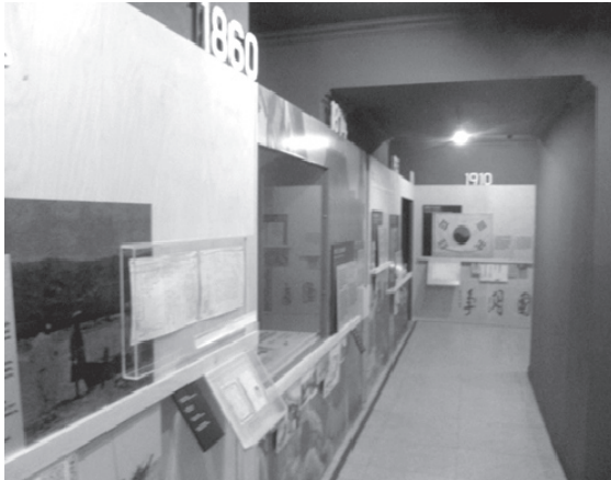
Figure 6 : The timeline corridor begins in 1860, when the first recorded ethnic Koreans entered the Russian Far East.

The Russian Korean History Museum emphasizes the trauma of Japanese occupation, Korean independence movement, and longing of eventual diasporic reunion in the homeland. This narrative fits squarely within the South Korean nationalist narrative. The museum timeline includes dates and events beginning in 1860 up to and including 1990. However, the formative years of Koryo saram identity are missing from the South Korean historical narrative of the Koryo saram . After the display on the 1937 deportation there are only two dates: 1940 and the