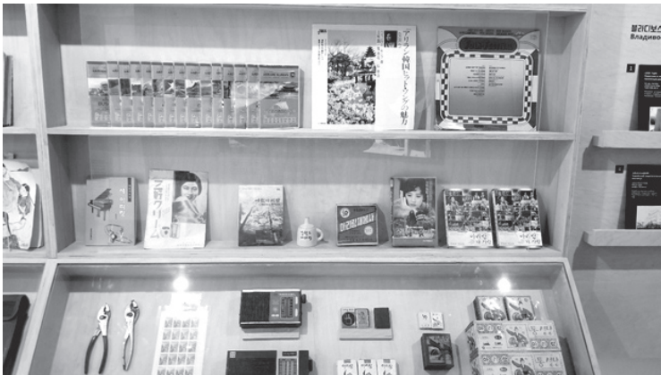
Figures 10(-13): Close-ups of ‘Arirang’ records, radios, pliers, cigarettes and matchboxes, films, records, and other memorabilia focused on the sensation of ‘Arirang’.

“I have never been. Where is it?” This was the most common response to inquiries to local Koryo saram regarding the museum. Despite the majority of Koryo saram not having visited the museum, 25 a few who had shared valuable insights; one com-