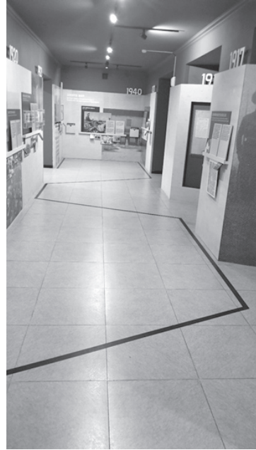
Figure 8: This view of the second portion of the timeline corridor reveals the jump in the timeline from 1940 to 1990 (not visible, but located before the threshold on the viewers left). The room to which visitors exit is the largest portion of the museum highlighting Arirang memorabilia.