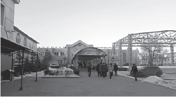
Figure 1: Exterior of front entrance to the Russian Korean History Museum and Korean Cultural Center in Ussuriysk, Russia.

Upon entering the exhibit hall, visitors are greeted by a donation box filled with Korean money (won), and the occasional Russian ruble. The walls are shrouded by historic photographs – full-wall expanses of monochrome offset and distinguishable against the pinewood finish of the bare walls. One can make out dirt roads, old ships and carts, and distinguish Asiatic faces among the labelled representations of Vladivostok. Maps abound in similar fashion; from the detailed map of the museum collections to the regional map of Northeast Asia, the Russian Far East (Primorskiy krai), and migration routes, to the map of historic markers, monuments, and buildings adorn the corridors. Former displays exhibit traditional Korean education, agriculture and weaving, and wedding ceremonies. Before entering a winding corridor, all visitors watch a brief video about the origins of the Koryo saram and their role in the Korean independence movement. The conclusion of triumphant music is always followed by applause, excepting the travel-weary pensioner searching for a seat or rambunctiously bored youngsters atop a father's shoulders. At the entrance to the corridor is an enlarged map of the former Soviet Union and greater Eurasia. If