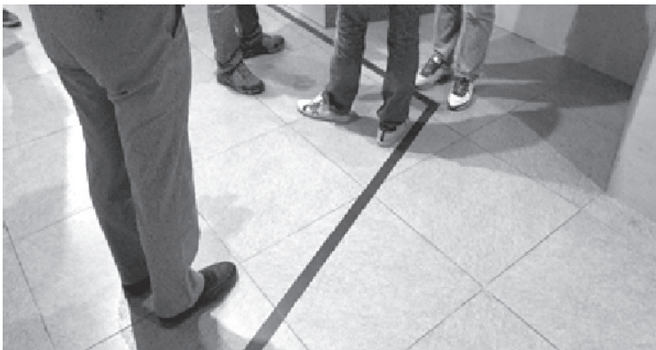
Figure 4: The line on the museum floor indicating the proper path of flow and artefact observation. This line serves as the narrative timeline of the museum.

Heritage is “signifying practice” and perspective of the past from a contemporary perspective (see Graham, Ashworth, and