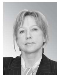
О. С. Дейнека 3