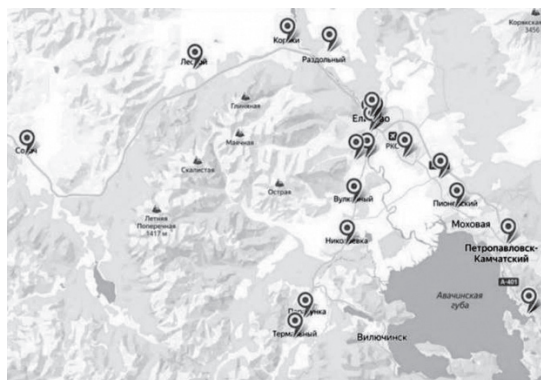
Рисунок 1. Расположение школ, в которых побывали участники экспедиции

Всего за время экспедиции было проведено более 60 фокус-групп и интервью с администрацией, учениками, учителями и родителями. Было проведено более 40 профориентационных тренингов для учеников 7–11-х классов и три семинара с учителями по проблемам исследовательского и проектного обучения. Поясним эти форматы работы детальнее.