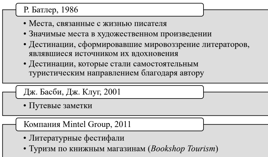
Рисунок 2. Виды литературного туризма