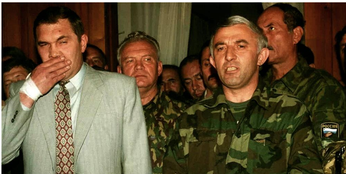
Лебедь и Масхадов в Хасавюрте.