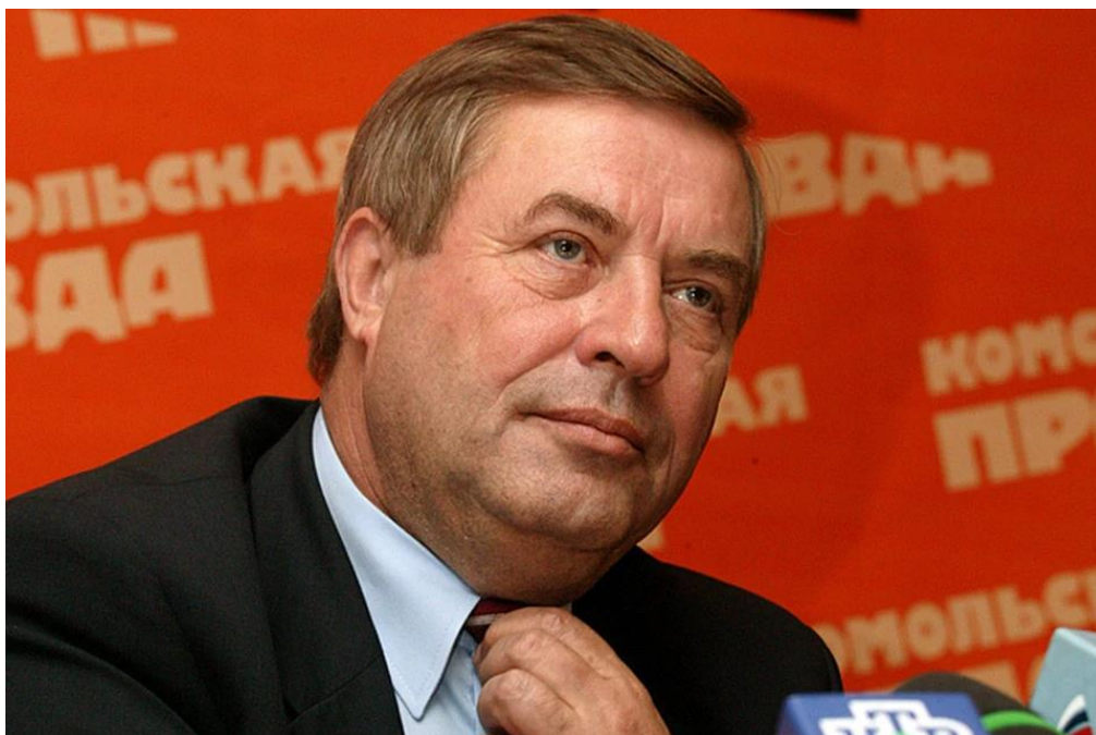
Геннадий Николаевич Селезнев.