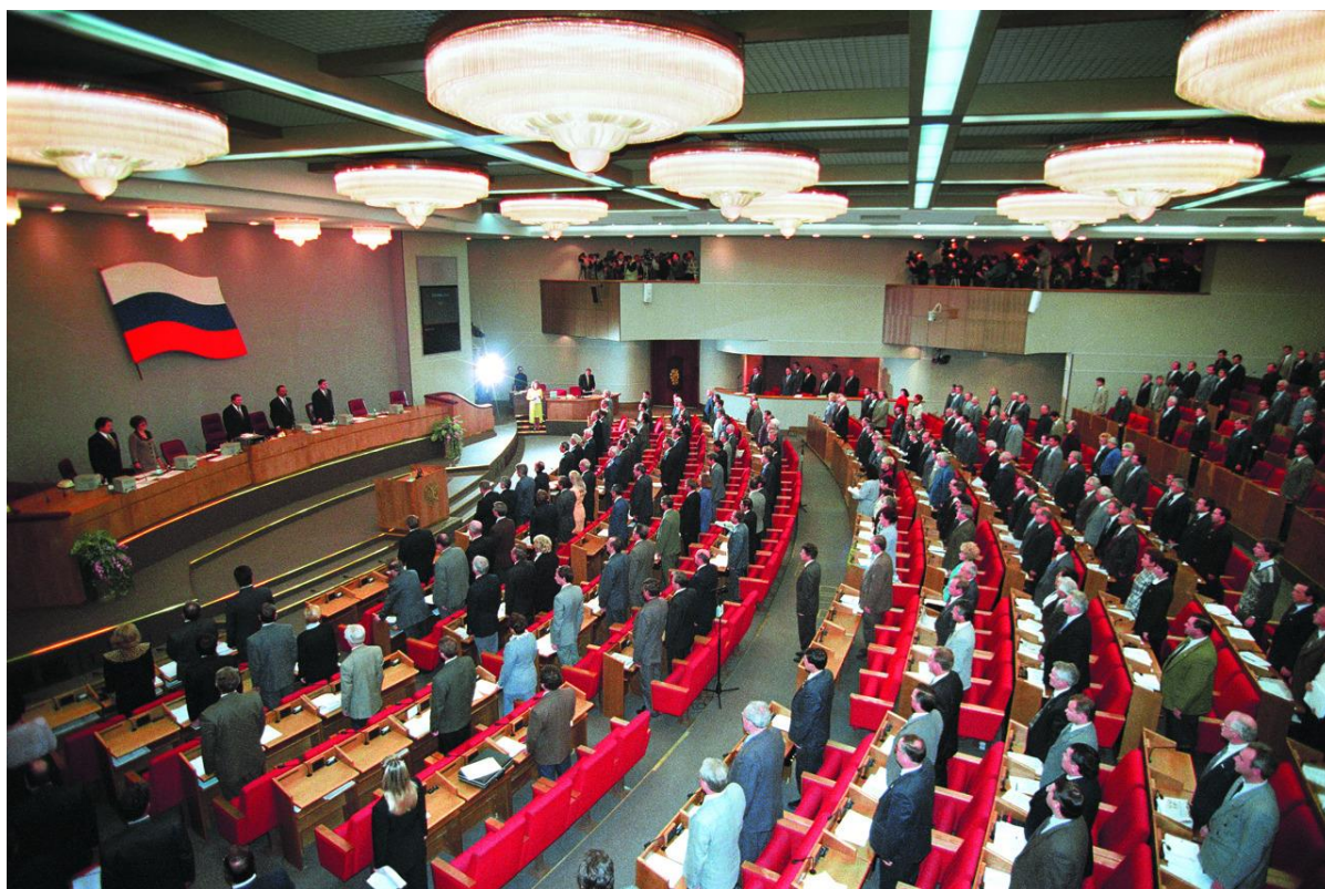
Открытие работы Государственной Думы 2 созыва.

Говорят, существуют колдуны и волшебники, способные по первому писку младенца распознать его характер, способности и предугадать судьбу на долгие годы вперед. Так или не так, но первый день работы новой Думы вышел очень показательным. Предлагаю читателям рабочую запись первого заседания с небольшими комментариями и ремарками автора.