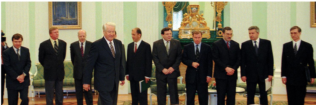
Хозяева страны. 1996.

Ельцин подписал какой-то указ об экономической безопасности, в котором “даровал народу” свою экономическую программу. Говорят, что избирательным штабом фактически руководит его дочь. По-видимому, она не понимает, что подобные жесты за 47 дней до выборов по меньшей мере неэффективны.