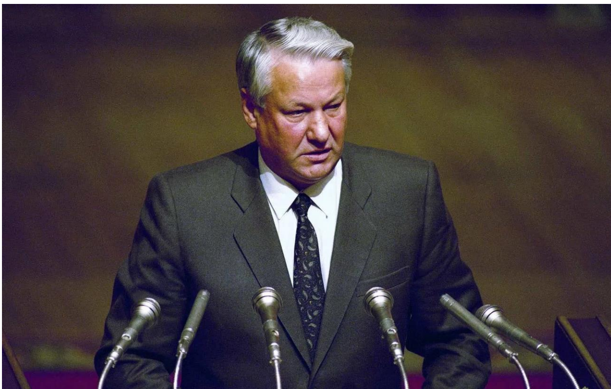
Б. Н. Ельцин представляет предвыборную программу.

Прежде всего, сказал Борис Ельцин, обращаясь к участникам собрания и всем своим сторонникам, хочу поблагодарить вас, многих и многих соотечественников, за поддержку моей деятельности на посту Президента. Я чувствовал ее в самые критические моменты для России. Я знал о ней, когда решал для себя нелегкий вопрос об участии в нынешних выборах. Признателен миллионам граждан, которые поставили свои подписи в пользу моего выдвижения. Скажу честно, ваша поддержка, ваша энергия это мои силы. И потому я твердо верю в нашу общую победу, в победу свободной России! Сегодня я вновь встречаюсь с вами, дорогими мне людьми, вижу много знакомых лиц. Быть в таком широком кругу соратников и единомышленников для меня всегда большой праздник. Я рад вновь видеть тех, с кем мы по воле народа начинали великое дело возрождения России. Я специально не представляю вам сегодня предвыборную программу. В соответствии с тактикой избирательной кампании она будет представлена несколько позже.