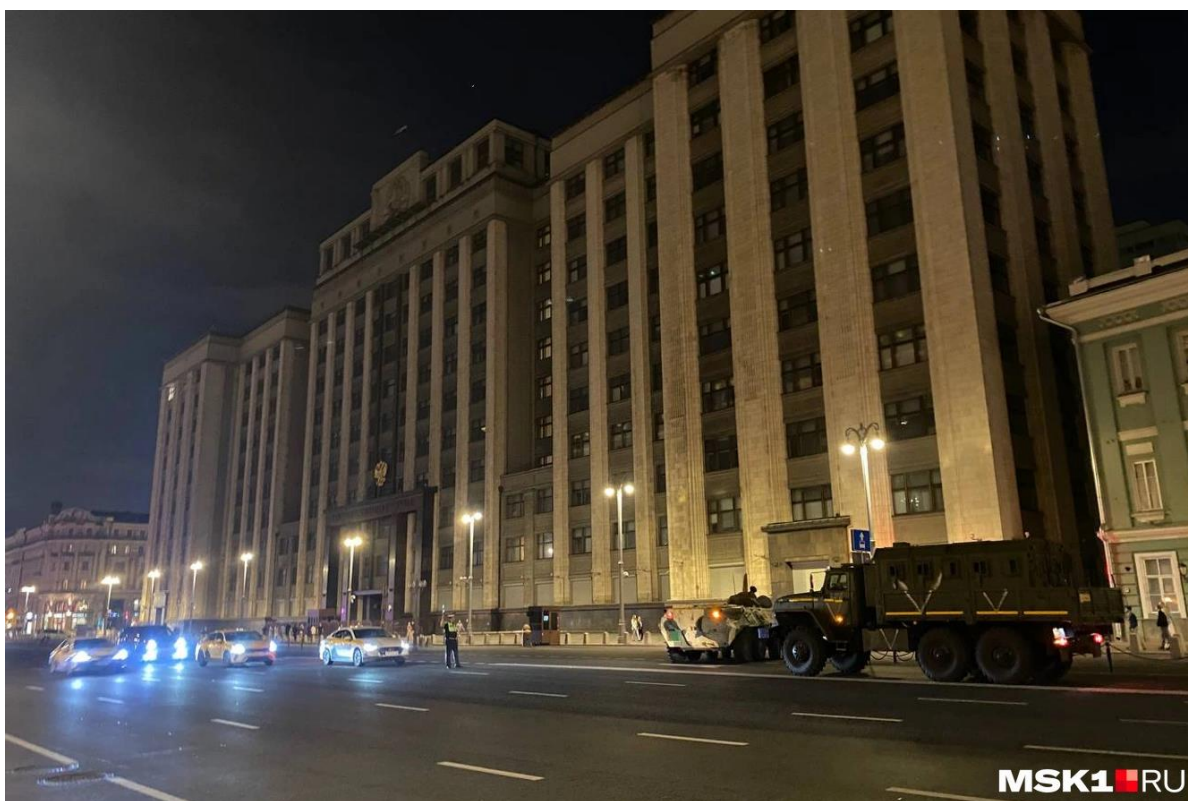
Государственная Дума под усиленной охраной.

(Голосование: за – 252, против – 33, воздержались – 5. Постановление принято).