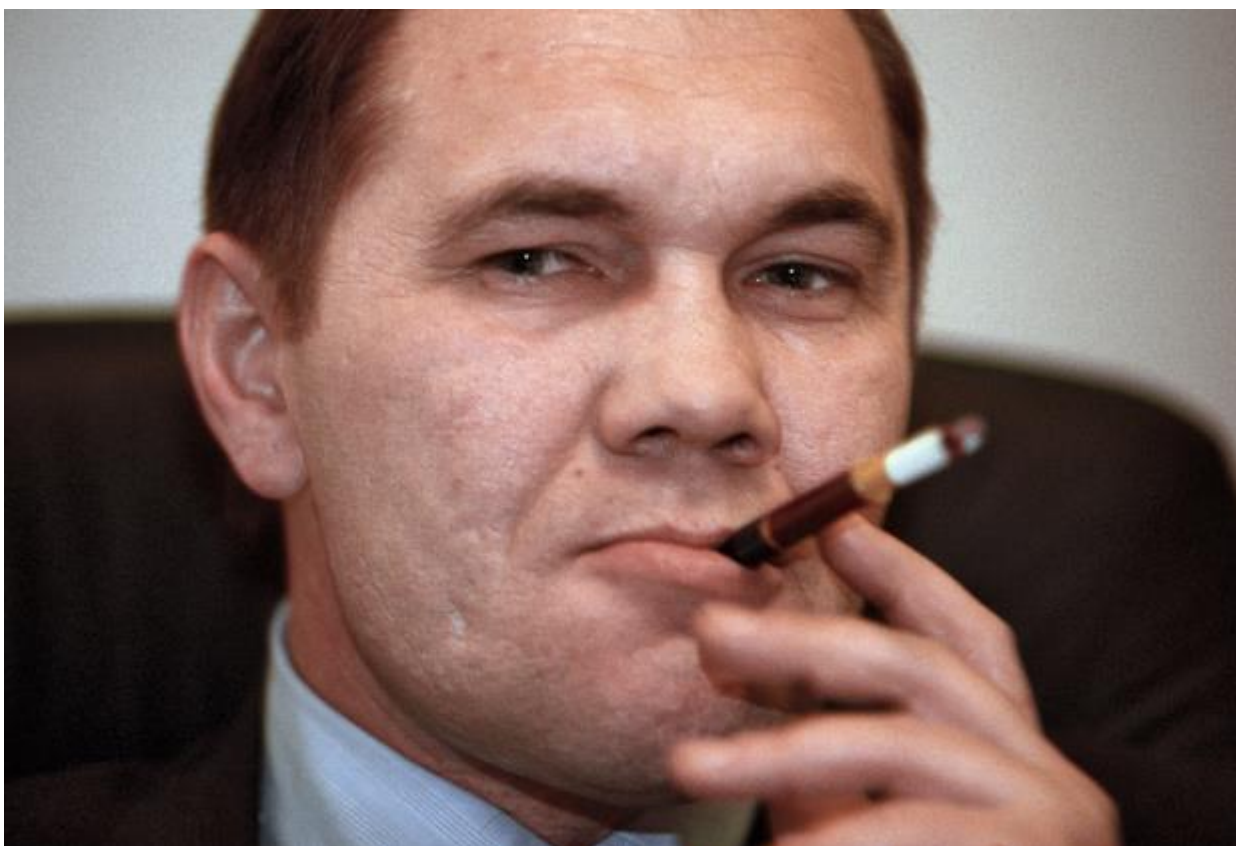
Александр Иванович Лебедь. Будущий президент России?

Вторая сенсация – уход министра обороны Павла Грачева. Ельцин с многозначительной кривой улыбкой сообщил, что принял его рапорт об отставке. В кулуарах крутятся две противоположных версии: отставка Грачева – одно из условий Лебеда при его назначении на пост; отставка Грачева – его ответ на назначение Лебеда. Скорее всего, обе отчасти справедливы. Два медведя оказались в одной берлоге.