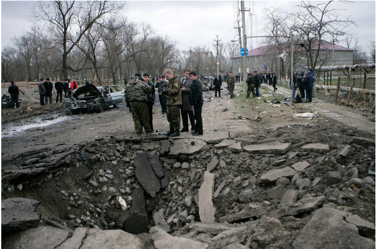
9 января 1996 г. Захват заложников в Кизляре и Первомайском.

Кизлярский конфликт показал, как на ладони, специфические особенности взаимоотношений власти и прессы. Террористы, захватившие заложниками женщин и детей, потребовали в первую очередь пропустить к ним... телевидение. Ибо прекрасно знают: в накладе не останутся. Несмотря на всю кровь, на многочисленные жертвы, на телеэкране они будут выглядеть героями. А вся грязь достанется работникам органов милиции, безопасности, военным.