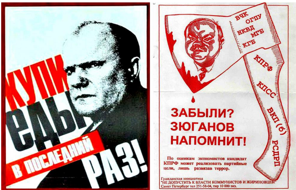
Предвыборный плакат «демократических сил». 1996.

Эти выборы – не политическое шоу, не схватка под ковром за почести, деньги и власть, не игра в "Лотто-миллион". Благодаря коммунистам и нацистам из ЛДПР, эти выборы станут очередным эпизодом в истории гражданской войны, которую коммунисты, то красные, то коричневые, навязали обществу еще 25 октября 1917 г.