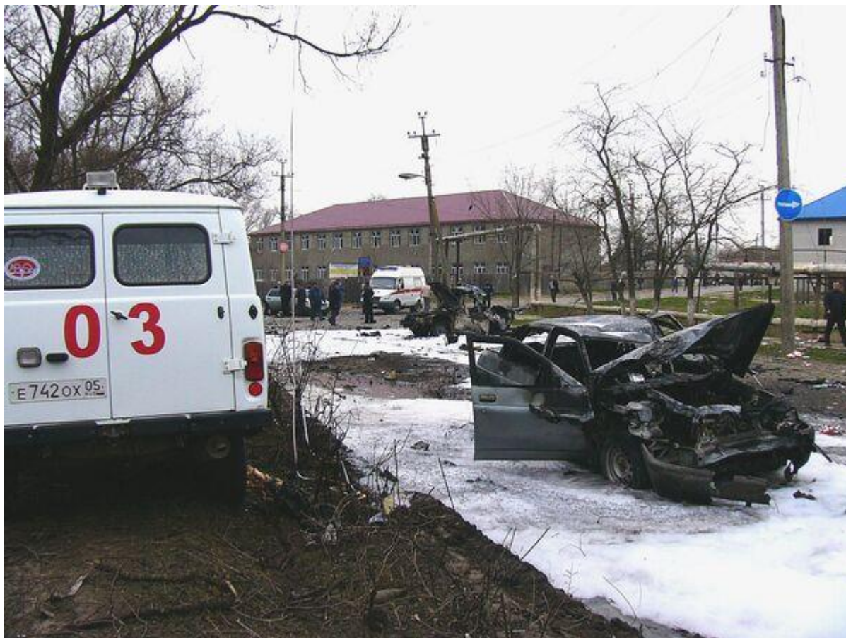
Теракт в Кизляре.

тапочки, мешочек с карамелями-подушечками. Сопровождающий рекомендует от маршрута не отклоняться и ни к чему не прикасаться – трое жителей Кизляра погибли от мин уже после освобождения.