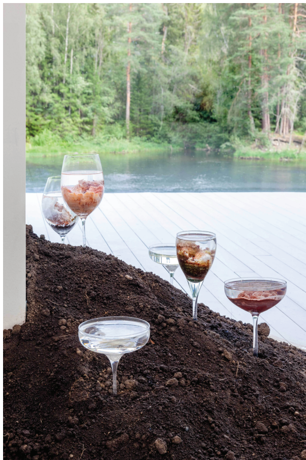
Ил. 3. Ане Графф. Кубки. 2021. Смешанная техника. Частная коллекция

кубок в образе аутоиммунной патологии (например, болезнь Альцгеймера, болезнь Паркинсона, рассеянный склероз, псориаз, фибромиалгию), на которую, вероятно, эти вещества повлияли.