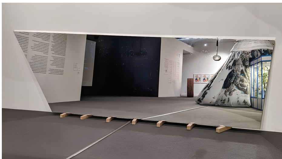
Ил. 1. Крис Мартин. Корабль дураков. 2017. Смешанная техника. Частная коллекция

мансистами и студентами. Автор произведения подчеркивает, что жизнь мигранта должна быть гармонично встроена в социальную и культурную жизнь принимающей страны, что, в свою очередь, требует преодоления значительных барьеров за счет индивидуального действия. Идеи за равные права человека; гендерное, расовое, этническое, религиозное равенство отражены в инсталляции голландской художницы П. Карсенхаут «Моя вина» (2020), посвященной вопросам власти, богатства и рабства в регионах, исторически контролируемых европейскими державами, а также в работе хорватской художницы С. Ивекович «Работы сердца» (2020), поднимающей проблему равноправия мужчин и женщин в европейских странах.