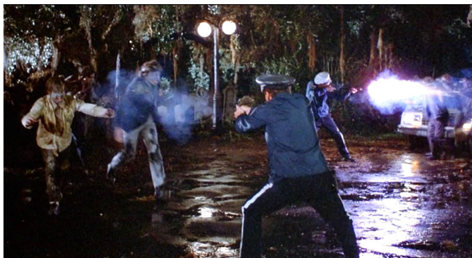
Рис. 2. Кадр из фильма «Возвращение живых мертвецов», реж. Дэн О'Бэннон, 1985 Fig. 2. Still from The Return of the Living Dead, directed by Dan O'Bannon, 1985 5

(режиссер Дэн О'Бэннон) вместо медленных, еле волочившихся зомби были показаны активные, быстрые живые мертвецы, целью которых было съесть мозги живых людей (рис. 2). Некоторые ученые даже посвятили сюжету увеличения скорости движения и силы зомби свои исследования (Dendle, 2011). В том же самом 1985 году вышла третья часть тематической трилогии Роме­ро «День мертвецов» (вторая серия — «Рассвет мертвецов» (1979)). Критик Ким Ньюман в своей книге «Кошмарные фильмы» заявил, что картина «Возвращение живых мертвецов» стала символом постмодернистской репре­зентации зомби, в то время как картина Роме­ро оставалась модернистской (то, что называется «modern horror») (Newman, 1989, p. 207). Но, возможно, фильм Роме­ро был куда более постмодернистским (в том плане, что он предвосхи­щал постгуманизм), если рассматривать его тематически, а не стилистически, к чему мы вскоре вернемся.