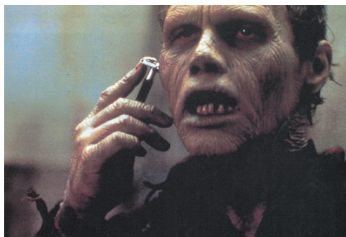
Рис. 1. Кадр из фильма «День мертвецов», реж. Джордж Ромеро, 1985

Так, хотя и не затрагивая тему постгуманизма, Марк Джозеф Роббинс рассуждает об эпохах американских фильмов ужасов (Robbins, 2020). Он называет три этапа становления американского хоррора: модерн — постмодерн — метамодерн. Для хоррора модерна характерна бинарная оппозиция человек/монстр. В этом конфликте побеждает человек. В хорроре постмодерна бинарная оппозиция монстр/человек переворачивается. Монстром становится сам человек, что мы наблюдаем в фильме Джорджа Ромеро «День мертвецов» (1985), о котором речь пойдет далее (рис. 1). Более того, теперь победа оказывается за монстром, даже если он остается монстром, угрожающим человеку. В хорроре метамодерна тенденция постмодерна усиливается: человек демонизируется, в то время как монстр гуманизируется. В метамодернистском хорроре противостояние человека и монстра становится вечным, и никто не побеждает. Можно сказать, постгуманизм в этом плане превосходит метамодернизм. Скажем так, в ситуации постгуманизма монстр и человек ищут способы совместной жизни — в теории на онтологическом уровне, а на практике — в продуктах массовой культуры вообще и в некоторых (постгуманистических) нарративах о зомби в частности.