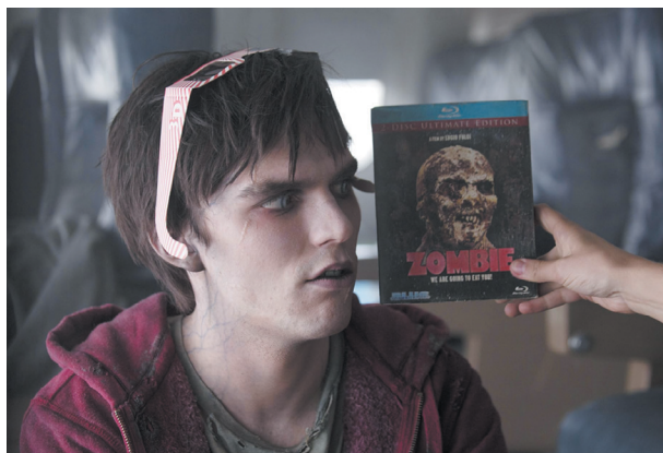
Рис. 4. Кадр из фильма «Тепло наших тел», реж. Джонатан Ливайн, 2013 Fig. 4. Stills from Warm Bodies, directed by Jonathan Levine, 2013 8