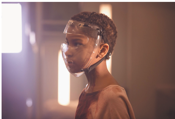
Рис. 5. Кадр из фильма «Новая эра Z», реж. Колм Маккарти, 2016 Fig. 5. Still from The Girl with All the Gifts, directed by Colm McCarthy, 2016 9