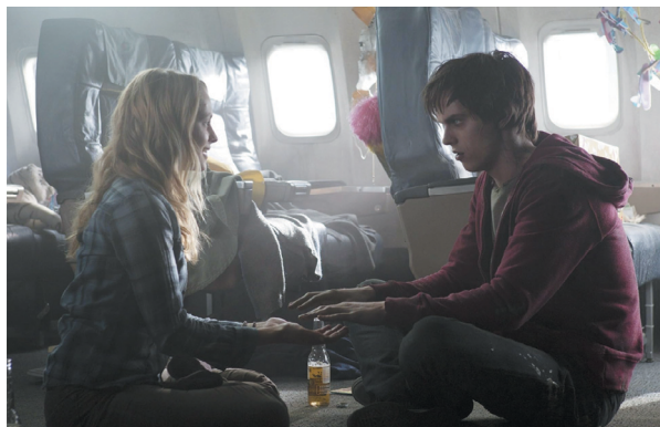
Рис. 3. Кадр из фильма «Тепло наших тел», реж. Джонатан Ливайн, 2013 Fig. 3. Stills from Warm Bodies, directed by Jonathan Levine, 2013 7

Примерно о том же основа сюжета сериала «Во плоти», в котором зомби были возвращены к жизни и теперь должны найти свое место в переучрежденном обществе. Но здесь как раз и начинаются новые социальные конфликты.