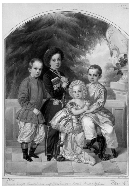
2 Гау В.И. Великие князья Николай Александрович, Александр Александрович (Александр III), Владимир Александрович, Алексей Александрович, сыновья Александра II 1851 Государственный Эрмитаж