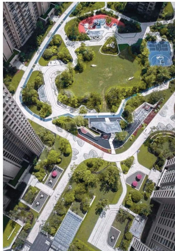
Рис. 5. Пример благоустройства жилого двора с разделением зон с помощью озеленения

Общим принципом размещения насаждений на территориях жилой застройки является сочетание открытых участков с компактными группами деревьев и кустарников и плотной застройки с хорошей ветрозащитой. Это позволяет улучшить микроклимат территории, создать хорошие условия аэрации и инсоляции для благоприятной жизнедеятельности жителей. С примером планировочной структуры с дополнительными зонами озеленения в жилом районе, которые обеспечивают повышение комфорта и качества жилой среды, можно ознакомиться на рис. 6.