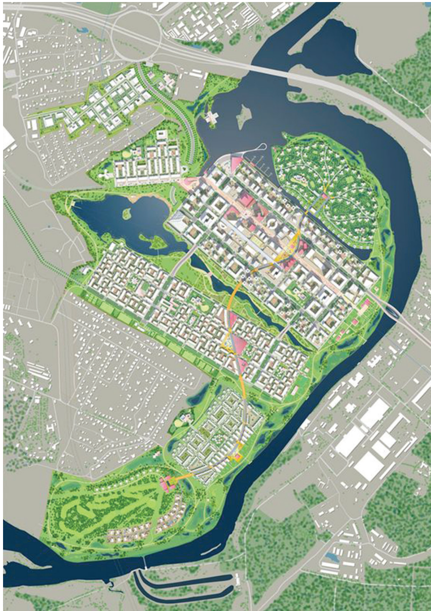
Рис. 6. Планировка с дополнительными зелеными зонами. Концепция ТПО «Резерв» и бюро Maxwan architects + urbanists