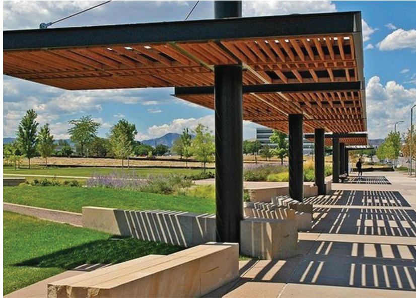
Рис. 4. Пример защиты пешеходной зоны от избыточной инсоляции с помощью архитектурной формы