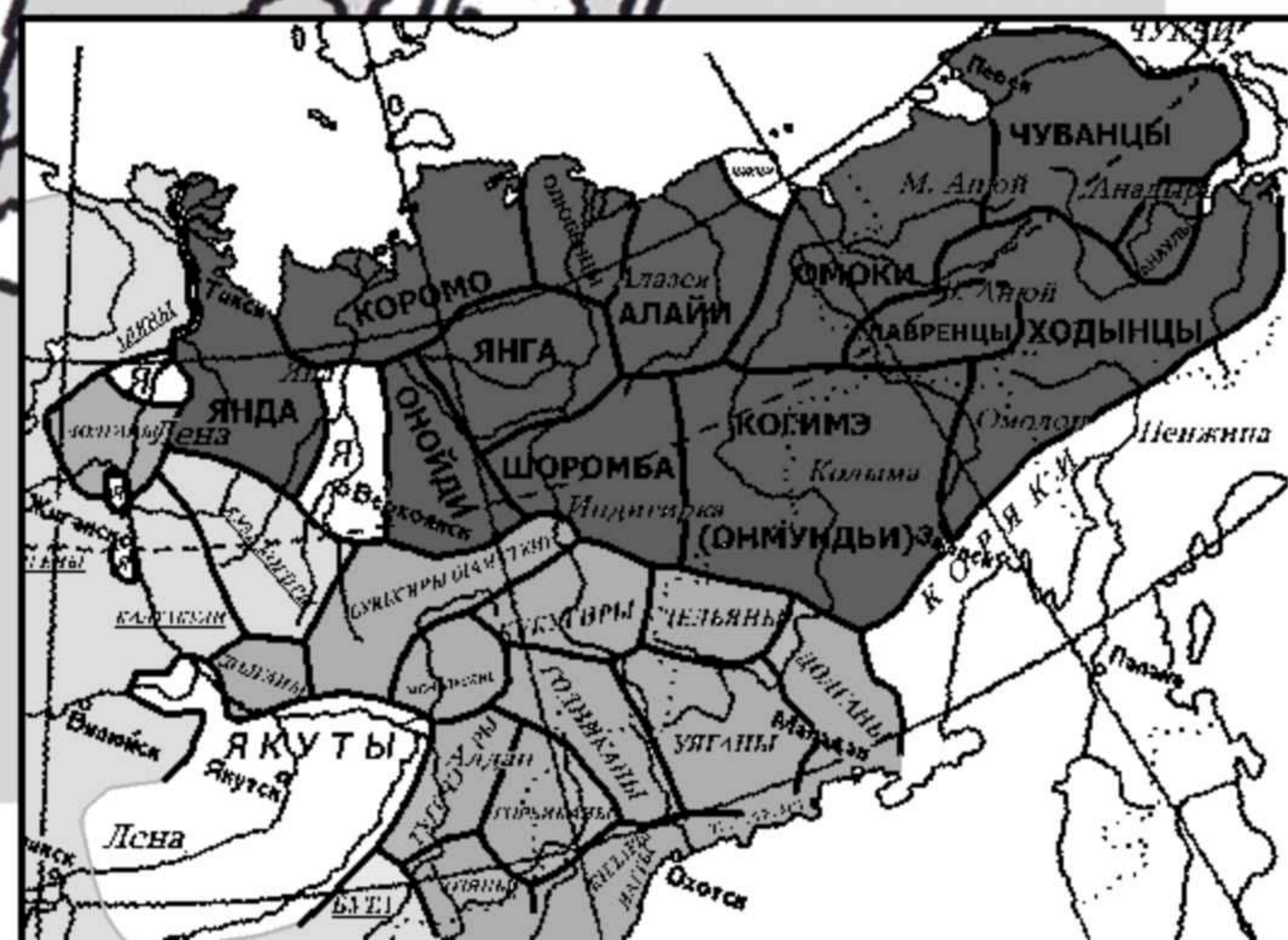
Карта 1. Юкагирский мир и его окрестности в 1630-х - 1640-х гг.