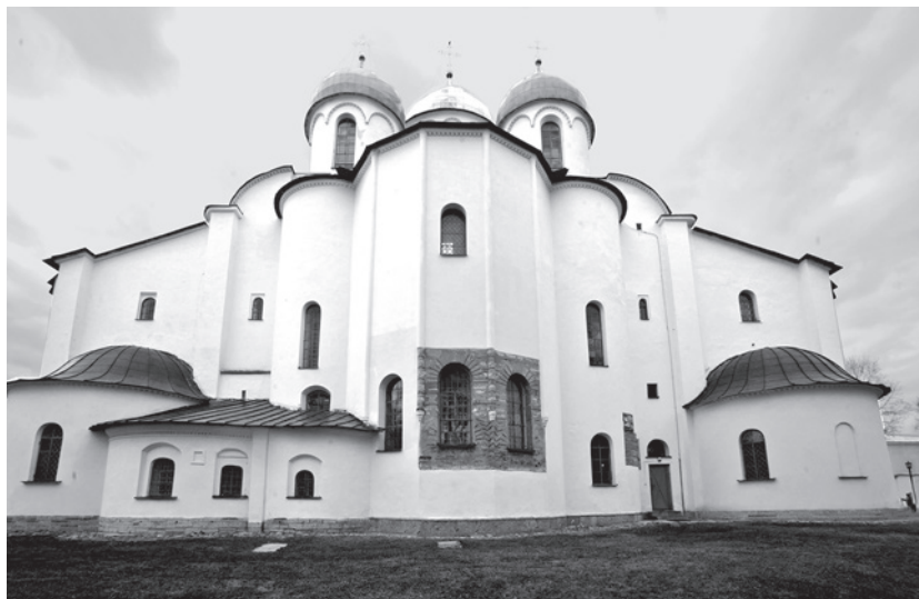
Илл. 6. Восточный фасад Св. Софии Новгородской

Южной Руси. Однако на новом месте облик этой кладки претерпел значительное изменение: преобладает каменная кладка из местных известняковых плит и блоков, но из плинфы сложены важнейшие конструктивные элементы: арки, паруса, а также горизонтальные пояса в местах укладки внутрискладочных дубовых связей. На фасадах плинфяная кладка встречается лишь на апсидах, арках и барабанах 67 . Керамическая декорация на фасадах храма скудна: зигзаг на апсидах и плоский бегунец на лопатке западного фасада.