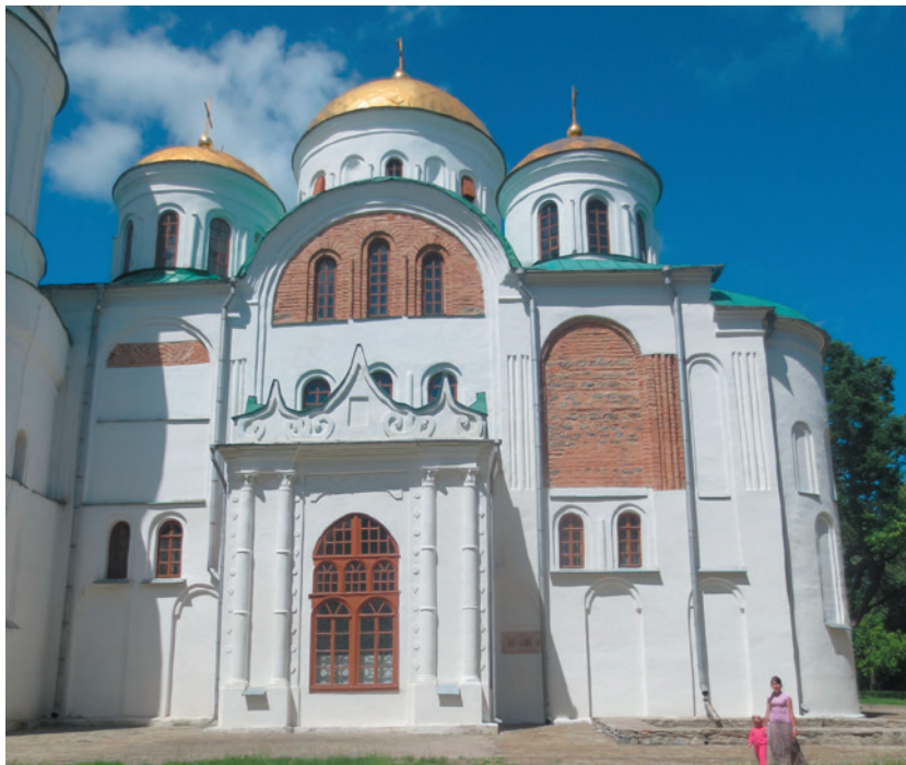
Илл. 2. Южный фасад Спасо- Преображенского собора в Чернигове

Спас Черниговский (первый этап строительства). Согласно «Повести временных лет», Спасо-Преображенский собор в Чернигове был заложен Мстиславом Владимировичем, и к моменту его смерти в 1036 году стены храма построены на высоту около 4 м 16 (до верхушек наружных глухих арок первого яруса). Этот первый этап строительства собора был хорошо изучен как реставраторами, так и археологами 17 , так что несмотря на завершение храма другими мастерами (см. ниже) мы можем судить о некоторых чертах первоначального замысла.