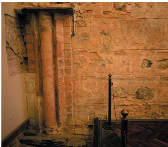
Илл. 4. Пучковый пилястр на южном фасаде Св. Софии Киевской

Итак, и конструкция, и строительная техника, и архитектурный декор Св. Софии Киевской демонстрируют сочетание константинопольских и «нестоличных» черт. В конструкции здания сложный архитектурный эксперимент с элементами константинопольского зодчества (трибелены, хоры, галереи, плоские террасы и др.) сочетается с «нестоличными» опорами (крестчатые столпы, «пришедшие», вероятно, из Десятинной церкви) и перекрытиями (вспарушенные и купольные своды) и отсутствием карнизов на уровне пят малых и больших подпружных арок. В стенах храма типичные для Константинополя кладки opus mixtum и со скрытым рядом (известна уже на Эски Имарет Джамии) соединяются с элементами керамического декора (меандр и кресты) и техники cloisonné . Наконец, на фасадах собора вроде бы господствуют такие «столичные» элементы, как пучковые пилястры (илл. 4) (известны в церкви Св. Георгия в Манганах, 1042–1055), тяги на углах граненых форм и разделка плоскостей нишами, однако ниши эти почти исключительно плоские, что типично для памятников, расположенных вне Константинополя. Что же касается мраморного и мозаичного декора интерьера собора, то первый точно не датируется 49 , а второй сделан поверх фресок и относится, вероятно, к 1052 году 50 .