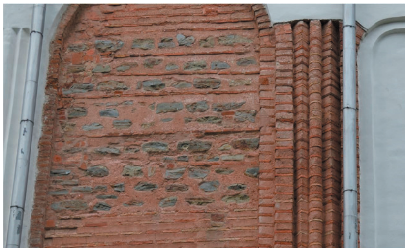
Илл. 5. Пучковый пиластр на северном фасаде Спасо- Преображенского собора в Чернигове

Все подпругные арки выделены и опираются с севера на лопатки, доходящие до выступа стены на уроне основания хор, а с юга – на фрагментарно сохранившиеся капители. Центральная и угловые ячейки наоса увенчаны куполами на высоких барабанах: такая схема характерна для заказов членов императорской семьи (церкви Богородицы Космосотиры в Феррах, ок. 1152; Св. Пантелеимона в Нерези, 1164) и восходит, по всей видимости, к престижному константинопольскому образцу (церковь Неа Василия I?). Боковые ячейки хор над нартексом были первоначально перекрыты купольными сводами на парусах, аналогичными сводам Св. Софии Киевской. Карниз внутри есть только под центральным барабаном; под арками помещены импосты из тонких шиферных плит. Снаружи позакомарное завершение имели лишь рукава креста (и слитая с западным рукавом центральная ячейка нартекса), тогда как остальные ячейки (угловые наоса и вимы и боковые нартекса) завершались прямыми карнизами, как и в Св. Софии Киевской.