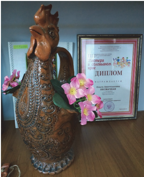
О. Несмачная. «Петух» [10]

Так, образ птицы является фигурантом-демиургом, который сотворил Мир. Именно птица-демиург, ныряет на дно Мирового океана и приносит кусочек земли, из которого создаётся мировое пространство.