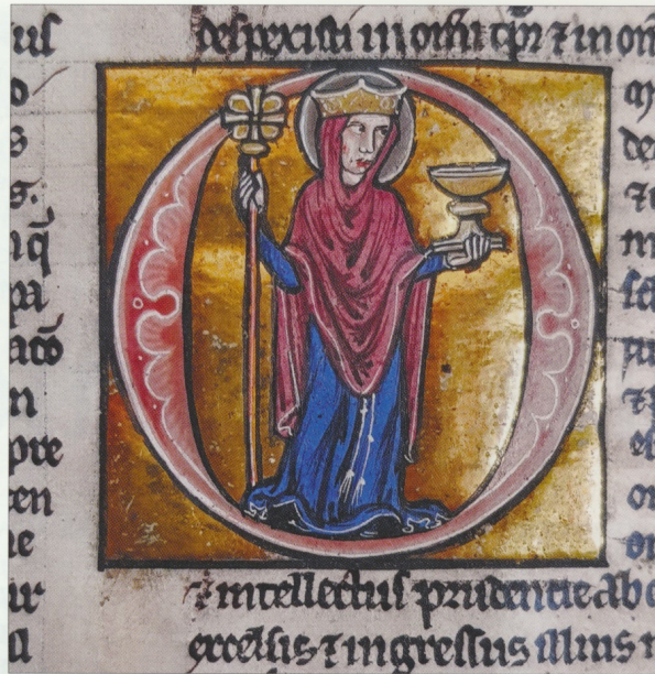
Парижская пергаменная Библия (см. с. 25). Фрагмент.

Самая ценная? «Апостол», переписанный в Константинополе в 1072 году, Евангелие начала XIII века из Ростова Великого, книги с автографами Н. М. Карамзина и В. А. Жуковского, портрет Пушкина, подписанный его рукой, пи-