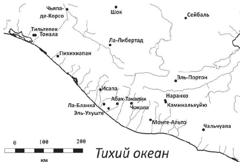
Рис. 1. Карта Юго-Восточной Мезоамерики с основными памятниками среднеформативной фазы