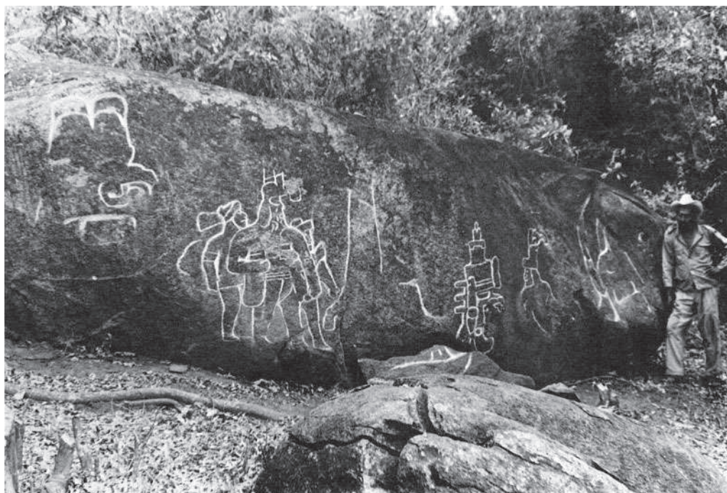
Рис. 5. Камень 2 из Пихихиапана. Линии рельефа прорисованы мелом (по: Наваррете 1974)