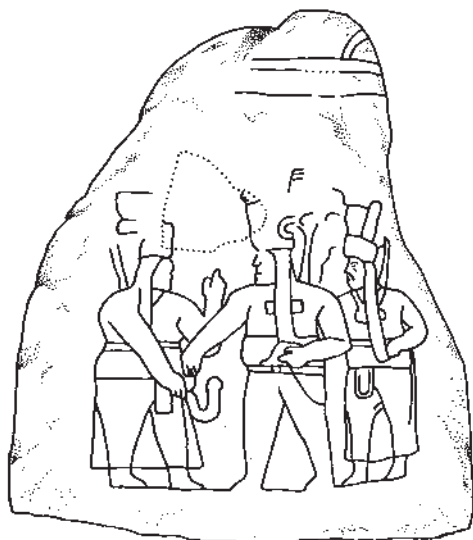
Рис. 3. Прорисовка рельефа на камне 1 из Пихихиапана (по: Navarrete 1974) Fig. 3. Drawing of the relief on Pijjiapan Stone 1 (after Navarrete 1974)