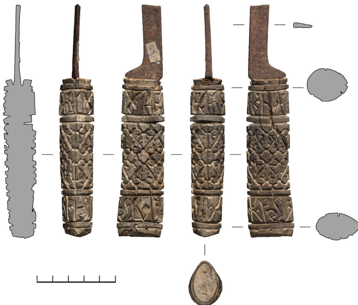
Рис. 3. Нож Б (РГМАА. № 0-3729). Общий вид. Рендер трехмерной полигональной модели и сечения, построенные по модели

деревянной рукояти, что, возможно, способствовало выкрашиванию инкрустации при эксплуатации ножа, особенно в условиях низких температур. Способ монтажа рукояти – вставной, хвостовик длиной около 10 см вставлен в грубо высверленное сквозное отверстие в рукоятке диаметром 5–6 мм и не доходит до обушка. За отсутствием обушка нельзя полностью исключить и сквозной способ монтажа (конец хвостовика мог обломиться вместе с обушком), однако по аналогии с ножом Б вставной способ монтажа более вероятен.