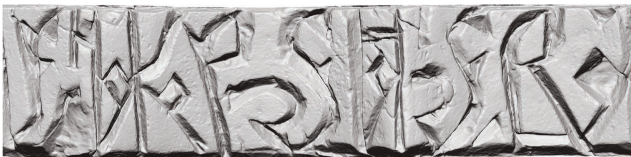
Рис. 8. Нож Б (РГМАА. № 0-3729). Развертка надписи у обушка. Рендер трехмерной полигональной модели с отключенной фотографической текстурой

отростками. Второе слово А. К. Станюкович угадал как имя отца в форме прилагательного притяжательного падежа – НВАНВ{А} . Оба слова отделены друг от друга вертикальной чертой-словоразделителем, и на 3D-модели хорошо видно, что для последней буквы в слове НВАНВ{А} резчик не рассчитал место и вырезал небольшую петлю на словоразделителе. Отметим следующие друг за другом две лигатуры – НВ и АН , а также переход О в А в первом заударном слоге, вполне допустимый в памятниках письменности XVI–XVII вв. (Тарабасова, 1986. С. 34). При этом начертание буквы А с горизонтальной верхней перекладиной, вертикальной правой мачтой, присоединенной к ее центру ромбовидной петлей, и наклонной левой мачтой абсолютно идентично начертанию этой буквы в надписи на ноже А. В надписи у обоймы-ограничителя (рис. 8) А. К. Станюкович верно прочитал контрактуру СНА с отсутствующим титлом. Следующее слово он определил как фамилию КОРСНА(Т?)ЄБА . Тем не менее 3D-модель надписи на нижнем регистре ножа дает бесспорный вариант чтения. По ней видно, что к нижней ноже буквы К присоединена буква А , вырезанная в виде ромба; нижние части букв С и Є украшены серповидными завитками, что дает чтение