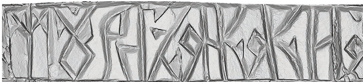
Рис. 6. Нож А (РГМАА. № 0-3730). Развертка надписи. Рендер трехмерной полигональной модели с отключенной фотографической текстурой

исследователям охватить всю надпись взглядом без вращения модели. Рендеры (растровые изображения) этих разверток позволили без особых затруднений дать побуквенное прочтение надписей на рукоятках ножей в комплексе с анализом палеографических особенностей литер.