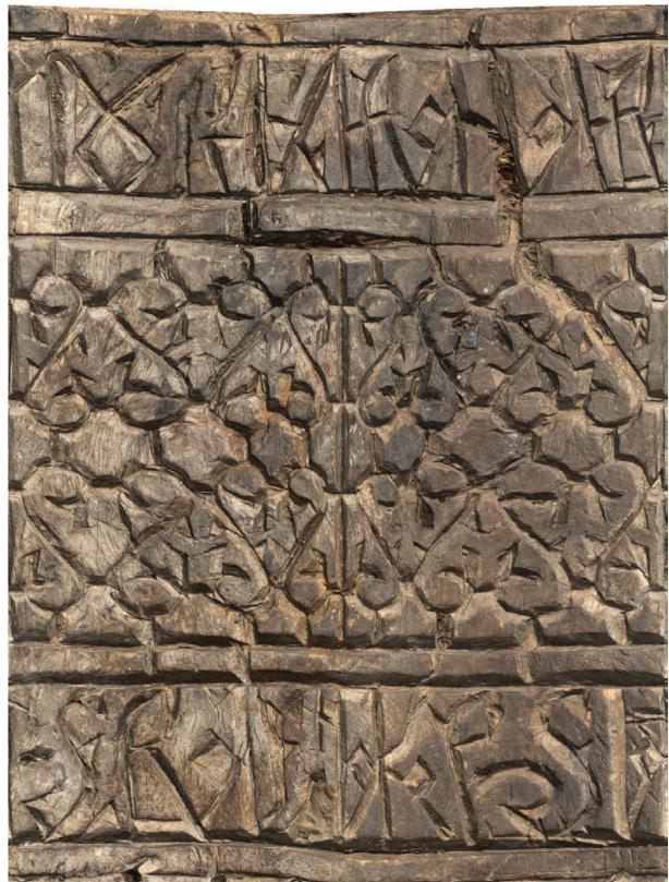
Рис. 5. Нож Б (РГМАА. № 0-3729). Развертка поверхности рукояти. Рендер трехмерной полигональной модели

Малый «формат» надписи на ноже А и сложность вязи, сплетающейся с элементами узора, вызвали затруднения в ее интерпретации. По свежим следам ее изучил известный археолог М. В. Фармаковский, предложивший чтение «Акакия Мурага». Последнее слово исследователь возводил к саамскому «мур» – море, считая, что муром поморы называли опытного моряка, мурманца (Окладников, 1948. С. 15). Палеограф и источ-