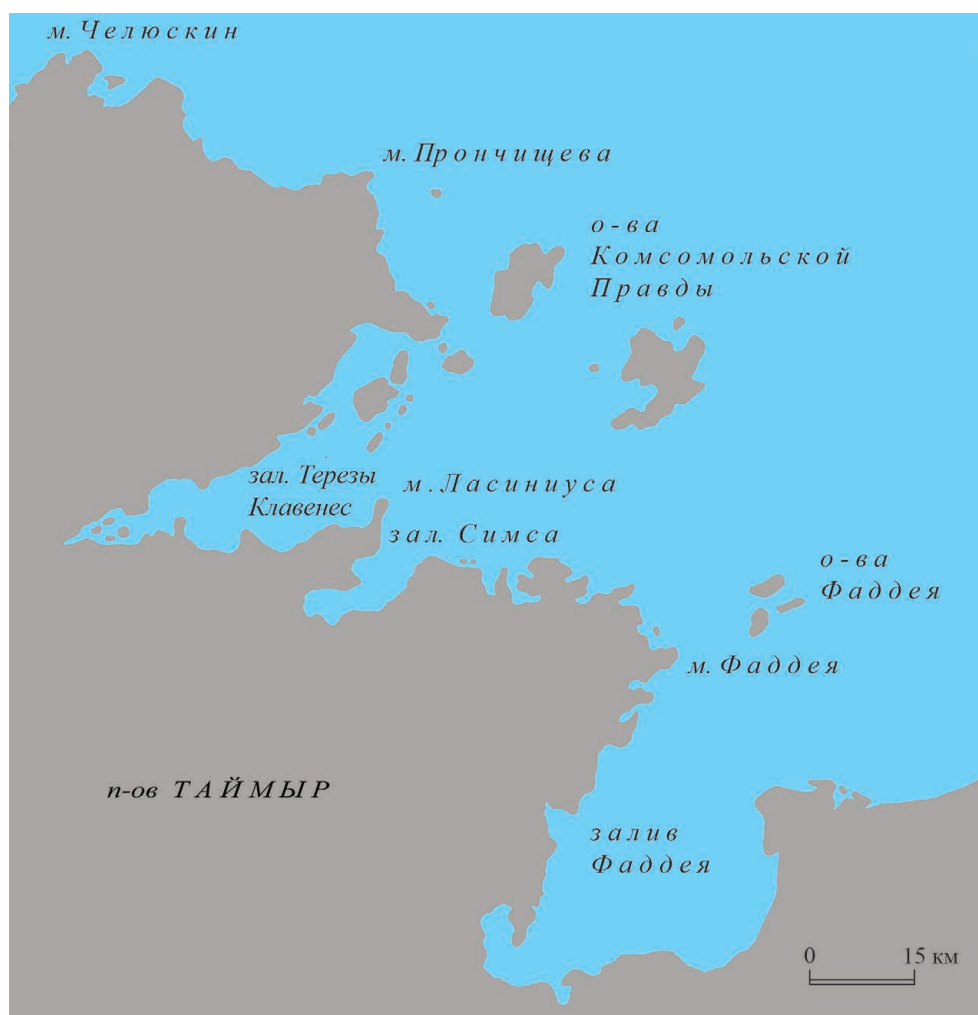
Рис. 1. Карта восточного побережья п-ова Таймыр

железного клинка (практически полностью сохранившегося у ножа А и обломанного у ножа Б) и деревянной рукояти, изготовленной из березового капа, опознаваемого по характерной свилеватости слоев древесины. Они относятся к большим ножам универсального назначения, обычным на русских памятниках позднего Средневековья и, в частности, в Западной Сибири – в Алазейском и Стадунском острогах и в Мангазее (Алексеев, 1996. С. 39, С. 113, Табл. 43; Белов, Освянников, Старков, 1981. С. 79–80, С. 140. Табл. 71, 1–9; Визгалов, Пархимович, 2007. С. 98, 99, 178, 179. Рис. 27, 28), но выделяются высоким качеством и продуманностью исполнения рукояти, имеющей анатомическую форму и обеспечивающей более удобный хват, чем традиционная прямая ручка овального сечения. Оба ножа несут следы многолетнего использования (сточенность лезвия, выкрошившаяся инкрустация, естественная заполированность ручки).