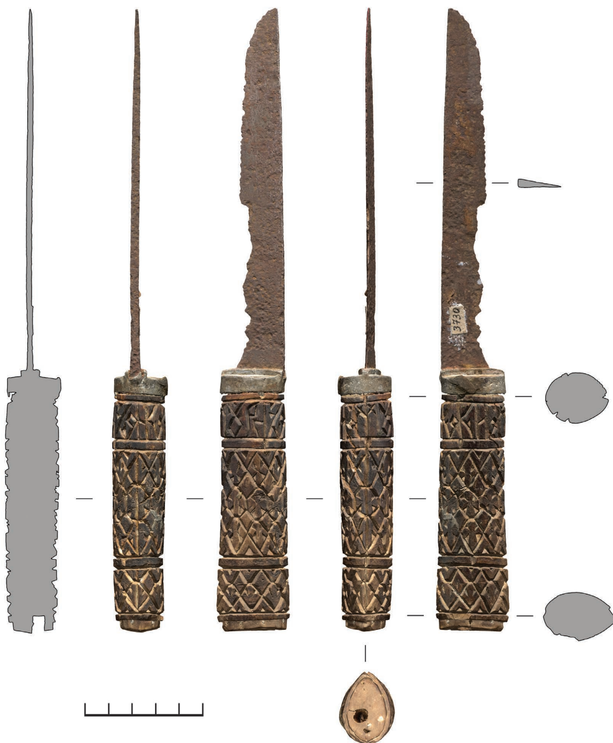
Рис. 2. Нож А (РГМАА. № 0-3730). Общий вид. Рендер трехмерной полигональной модели и сечения, построенные по модели