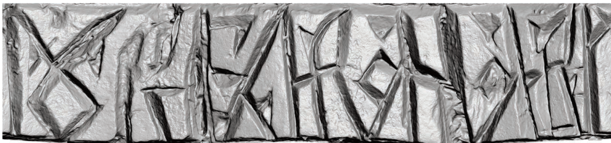
Рис. 7. Нож Б (РГМАА. № 0-3729). Развертка надписи у обоймы-ограничителя. Рендер трехмерной полигональной модели с отключенной фотографической текстурой