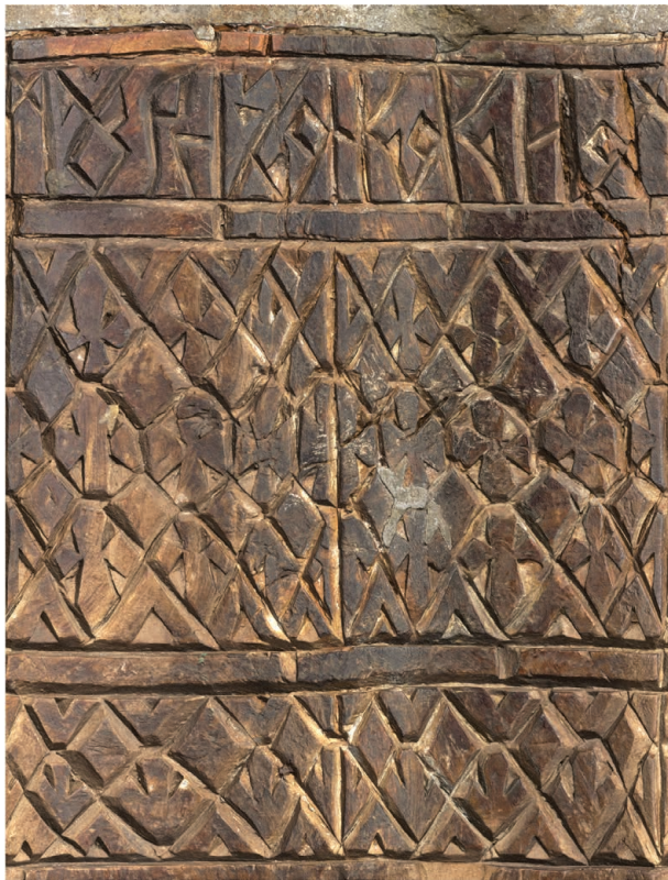
Рис. 4. Нож А (РГМАА. № 0-3730). Развертка поверхности рукояти. Рендер трехмерной полигональной модели

Надпись на ноже А выполнена на пояске у обоймы-ограничителя, высота строки – 1,4 см. Надпись на ноже Б также вырезана на двух поясках у обоймы-ограничителя и у обушка рукояти; высота строки в обоих случаях – 1,6 см. Сверху и снизу эпиграфические поля ограничивают полосы, не заполненные орнаментом и отделяющие надпись от металлических деталей и орнаментированной части рукоятки. Надписи выполнены геометрической вязью без характерных для рукописного письма диакритических и надстрочных знаков и дробления мачтовых лигатур в технике асимметричной трехгранно-выемчатой резьбы с выборкой фона вокруг букв. По-видимому, резчик брал за образец надписи на изделиях из металла или, менее вероятно, ткани (Николаева, 1971. С. 64–65).