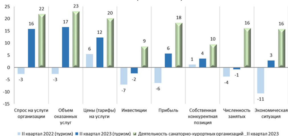
Рис. 3. Ключевые операционные показатели в туристических и санаторно-курортных организациях (баланс 3 , %)