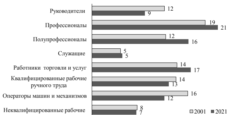
Рис. 2. Динамика профессиональной структура занятого населения России после перекодировки, 2001–2021 гг., %