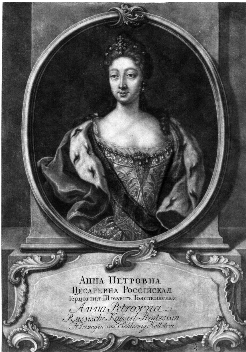
Анна Петровна, герцогиня Шлезвиг Голстейнская. 1742 г. Иоганн Штенглин (ок. 1700—1710—1777); меццо-тинто