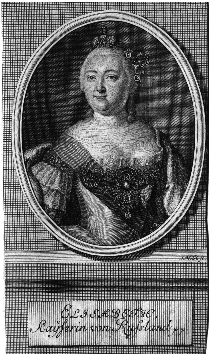
Елизавета Петровна, Императрица Российская. 1740-е гг. Иоганн Мартин Бернигерот (1713–1767); гравюра резцом и пунктиром