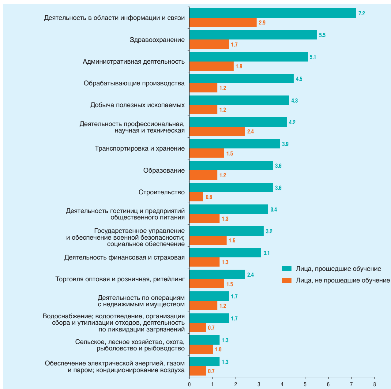
Динамика уровня заработной платы лиц, прошедших и не прошедших обучение, в течение трех месяцев до начала и после окончания обучения по видам экономической деятельности: 2022 (тысячи рублей)

Источники: Роструд, Пенсионный фонд Российской Федерации.