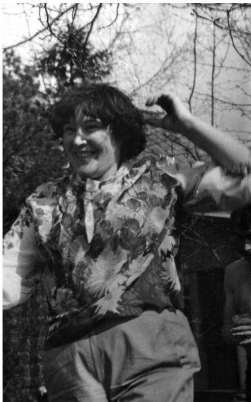
1984 г. Танцы с фольклорной группой