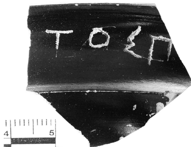
Рис. 5. Храмовый килик Артемиды Пифийской М-2016 оп. № 248.