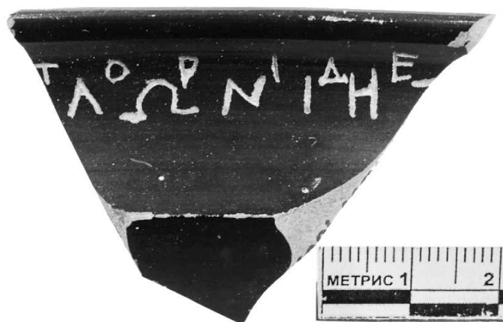
Рис. 1. Посвящение Аполлону Врачу (Пред)водителю Дельфинию. М-2017 оп. № 158.