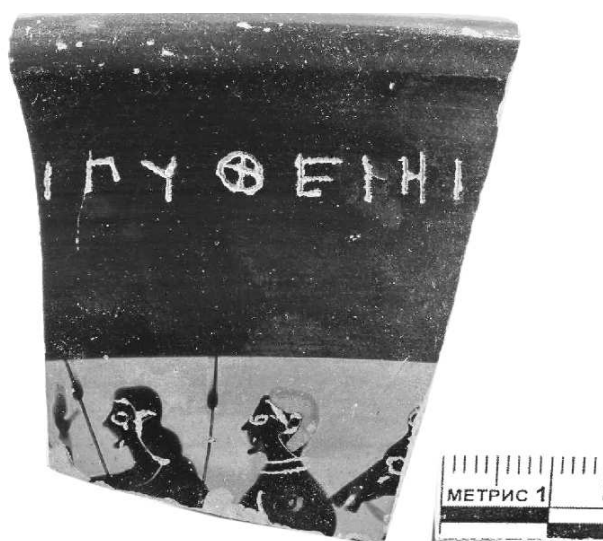
Рис. 2. Посвящение Артемиде Пифийской. М-2017 оп. № 67.