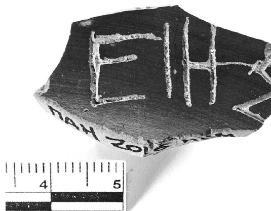
Рис. 3. Храмовый килик Артемиды Пифийской М-2016 оп. № 230.