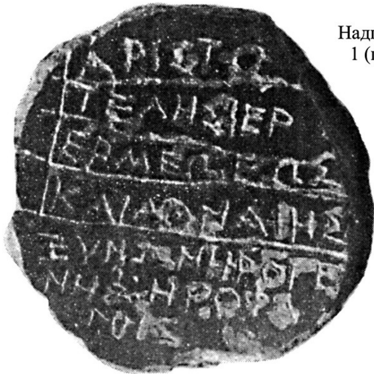
Рис. 1 Надпись на остраконе DefOlb 1 (по: А.В. Белоусов 2020)