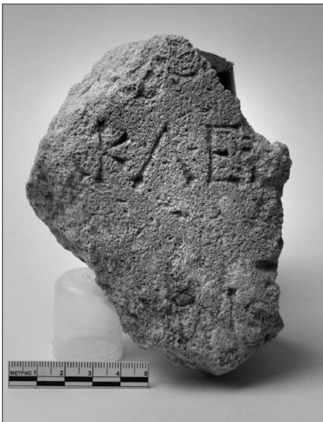
Рис. 2. Декрет в честь гераклеота из раскопок Пантिकाпея в 2018 году.