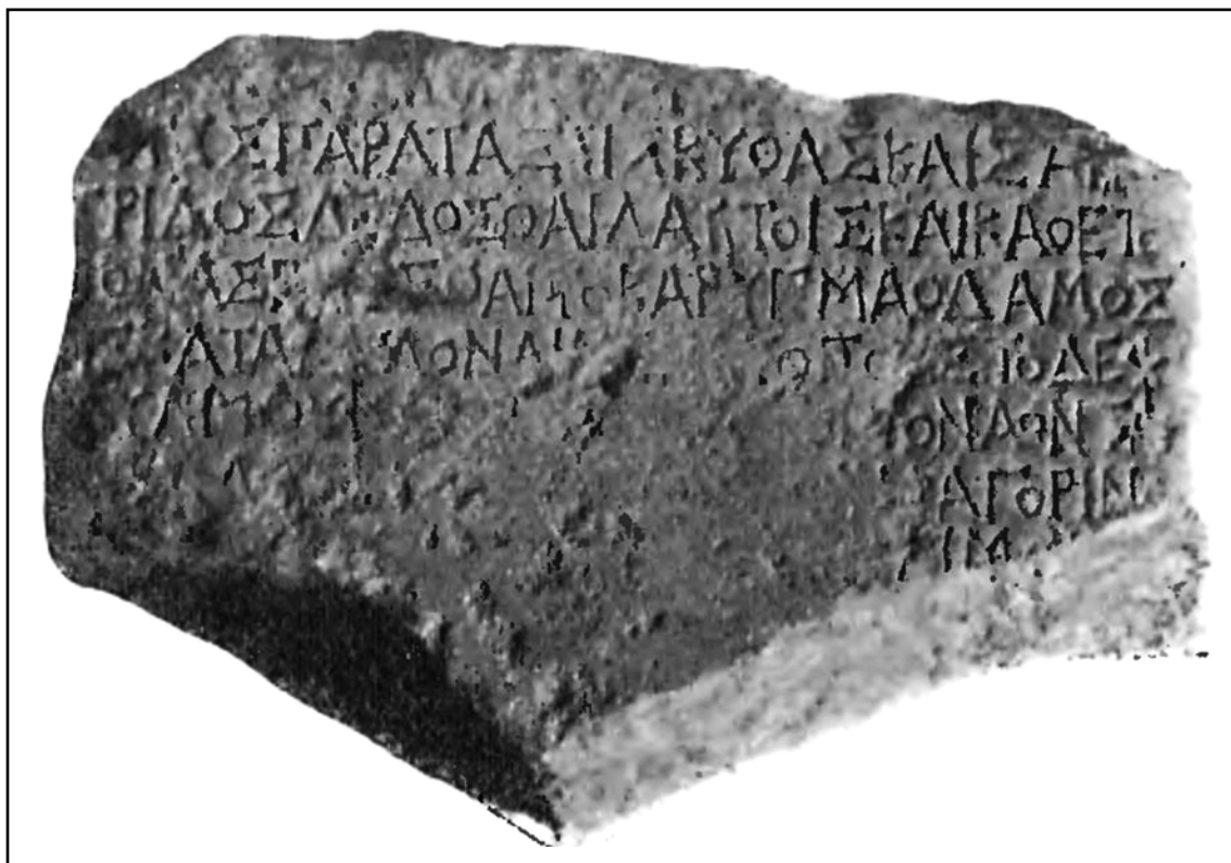
Рис. 3. Декрет IOSPE I² 353.