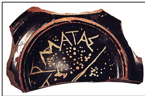
Рис. 1. Заклятье на сарматов на кольцевом поддоне килика IV в. до Р.Х. из Пантикапея (ПАН-1999, оп. 89. Фонды ВКИКМЗ. №КМГ 2979).