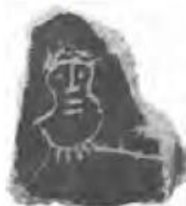
НЭ 1965. Бородатая мужская протома в фас