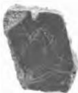
Ц 1975 пл. VI-X, внутри бастиона «А». Пе- редняя часть корпуса лошади, вид сбоку