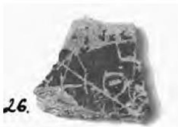
ПАН-2018 оп. 63 № 14