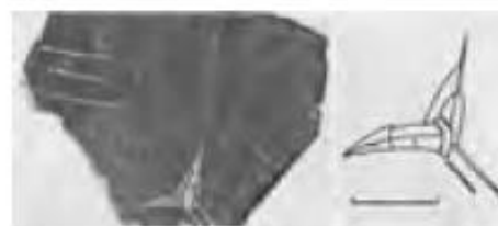
НЭ 1958 Пл. 72 шт. 6 Сцена сражения: вёсла одного и таран другого корабля