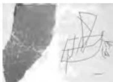
НЭ 1962 пл. 93 шт. 3 Судно с треугольным парусом