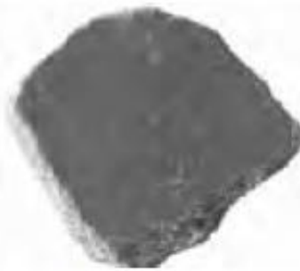
Ц 1981 кв. 86, шт. 2, поп под кладкой №78. Мужская голова в профиль