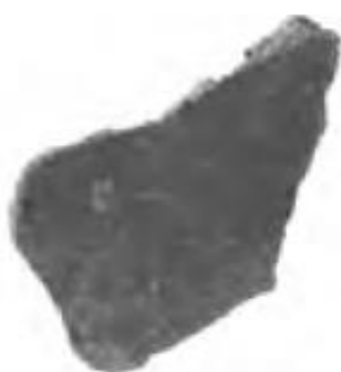
ЭР 1946 пл. VI шт. 16 Снасти