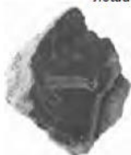
Ц 1981 кв. 86, шт. 7. Гениталии