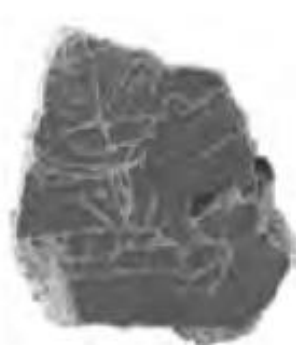
ЭР 1946 пл. VI шт. 16 Фрагменты четырёх судов