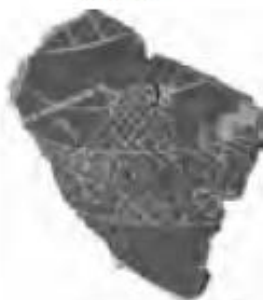
НЭ 1959 пл. 11 шт. 6. Суда с палубными надстройками