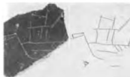
НЭ 1962 пл. 93 шт. 3. Корабль с двойным парусом