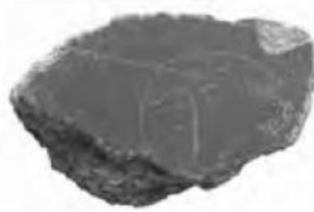
Ц 1979 Кладка №19А Магия: перечёркнутое лицо в фас