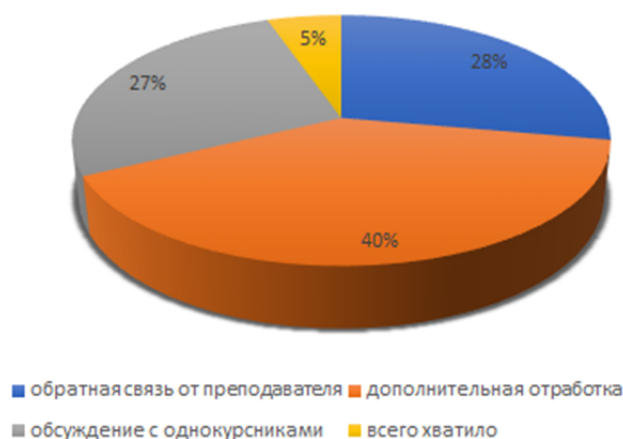
Рис. 2. Анализ ответов на вопрос о том, что студентам не хватало при работе с MOOK

Чтобы выяснить, что студентам не хватало для полностью удовлетворительного опыта прохождения онлайн-курса, им был задан соответствующий вопрос. Результаты (рис. 2) показывают, что 40% хотели бы иметь возможность дополнительной отработки материала, примерно по четверти всей когорты – возможность получения обратной связи от преподавателя и обсуждения материалов с однокурсниками. Студент(ка) отмечает, что в курсе хорошо подана грамматика, однако намного лучше узнавать новую программу от преподавателя на офлайн-парах, где можно задать вопросы и получить обратную реакцию .