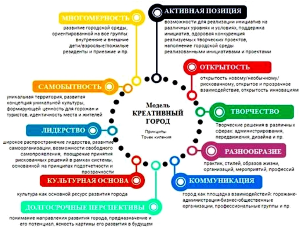
Рис. 1. Принципы развития городов через культурную и творческую составляющие