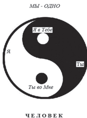
Рис. 5. Личность в любви (=Человек). Идея равенства взаимоприсутствия: «Я в тебе = Ты во мне»

Пятое звено — Человек (= всеобщее Я) , форма существования личности индивида, включающая в себя воспроизводство отношений с другими индивидами как носителями его отраженного Я и источником их собственной отраженной субъектности в нем в качестве Я , что выражается в поддержке и развитии друг друга как личностей [45] (рис. 5).