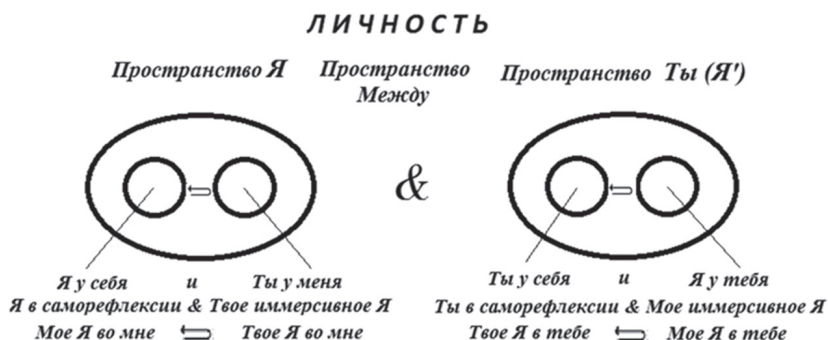
Рис. 4. Личность: штрихи к портрету

этом рождаются (лица, голоса, осязаемое присутствие человека в человеке), — это осознанные представления Я о себе на фоне представлений о других Я и в соотношении с ними. В целом таков полюс индивидуальности личности.