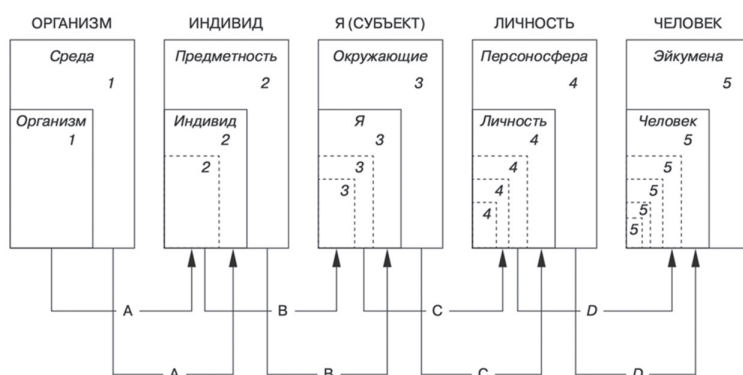
Рис. 3. Ступени causa sui 1

Рассмотрим последовательные формы субъектности, представленные в категориальном строе психологии [76] (рис. 3).