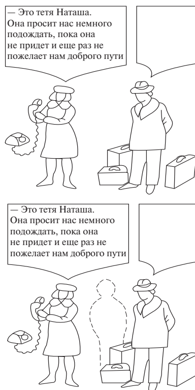
Рис. 1. Пример тестового материала модифицированного варианта фрустрационного теста Розенцвейга