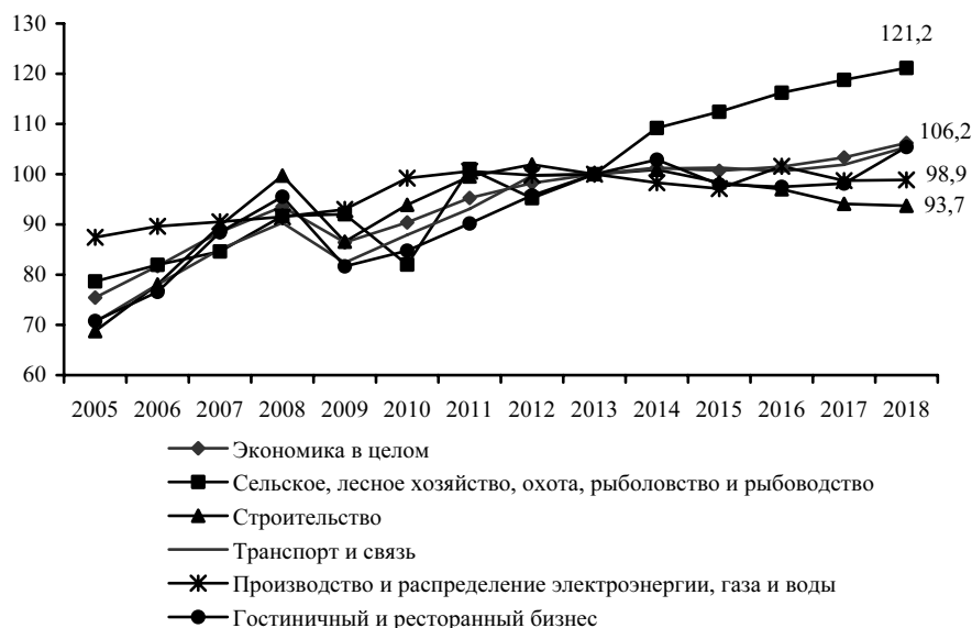
Рис. 2. Динамика добавленной стоимости по отраслям (в постоянных ценах, 2013 = 100%)

Несмотря на то, что в численности занятых в сельском хозяйстве в исследуемом периоде наблюдался нисходящий тренд, отраслевые объемы добавленной стоимости стабильно росли (рис. 2). При этом в санкционном периоде 2015–2018 гг. сельское хозяйство продемонстрировало более чем двукратное превышение темпов роста ВДС относительно экономики в целом (2,6% против 1,2%).