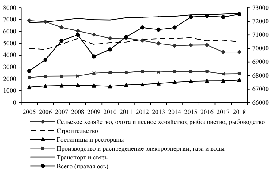
Рис. 1. Численность занятых по отраслям, тыс. человек

Численность занятых в сельском хозяйстве России снизилась за 2005–2018 гг. на 38% (или 2,7 млн человек), в то время как в экономике в целом возросла (6%), в том числе в отраслях, рассматриваемых в качестве контрольной группы 4 (рис. 1). В санкционный период 5 2015–2018 гг. динамика занятости в сельском хозяйстве была неоднозначной. Если в 2015–2016 гг. численность работников стабилизировалась, переломив устойчивый нисходящий тренд предыдущих лет, то в 2017 г. – резко сократилась. Следует пояснить, что динамика 2017 г. связана не с происходящими в отрасли процессами, а с изменением методологии учета Росстатом численности занятых в домашних хозяйствах в используемых данных «Обследования рабочей силы» 6 . Поэтому оценки изменения занятости в сельском хозяйстве в 2017 г. не могут быть корректно интерпретированы в контексте различия эффекта контрсанкций и общей экономической динамики 7 . В 2018 г. численность занятых в отрасли демонстрировала стабилизацию, как и в 2015–2016 гг.