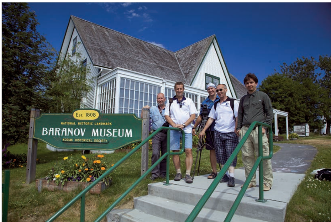
Музей правителя Русской Америки Александра Андреевича Баранова в городе Кодьяк

в музее университета города Фербенкс. Позднее редут был включен властями США в число объектов американского культурного наследия. На момент нашей экспедиции не было достоверных сведений, сохранились ли здесь хоть какие-то следы сооружений, возведенных русскими, не были известны современные координаты. В лесных дебрях нам с большим трудом удалось обнаружить фрагменты сооружений Колмаковского редута - остатки старых бревенчатых срубов, фундаменты, которые находились среди плотных зарослей.