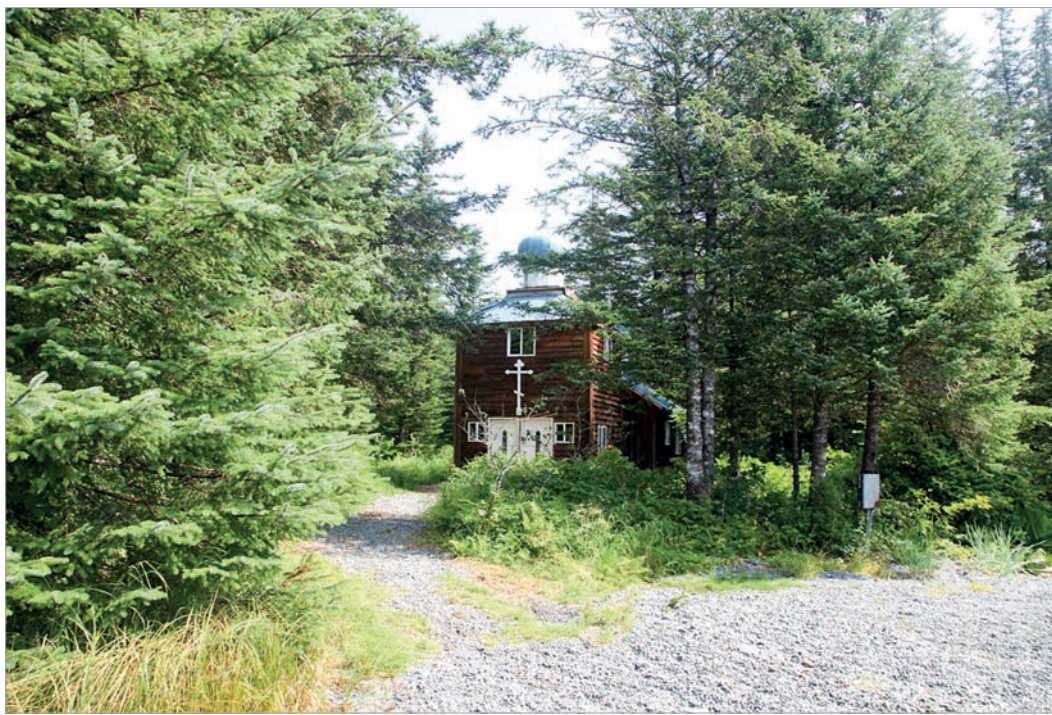
Православная церковь на острове Хинчинбрук

Непохожей на предыдущие стала экспедиция 2013 года. Ее участники отправились обследовать Алеутские острова на арендованной для этого яхте. В общей сложности за два месяца мы прошли около 4,5 тыс. километров вдоль архипелага, который с конца XVIII столетия активно осваивали российские промышленники. Именно с их приходом сильно изменилась жизнь здешнего коренного населения - алеутов и аляутиков, близких родственников эскимосов. Русские принесли с собой новые орудия труда, одежду, еду, православие.