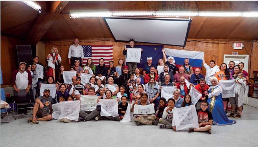
Встреча с жителями деревни Нанвалек

ральных каналах телевидения, многие из них стали победителями и лауреатами российских и международных кинофестивалей.