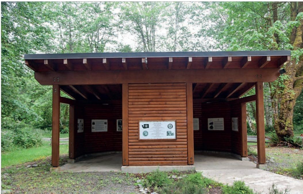
Мемориальный павильон в районе крушения судна «Св. Николай»

Мы посетили и обследовали практически все места русских поселений юго-восточной части Аляски. Получены новые уточняющие данные об их точном расположении, что даст новые направления более детальных исследований о русском наследии архипелага Александра.