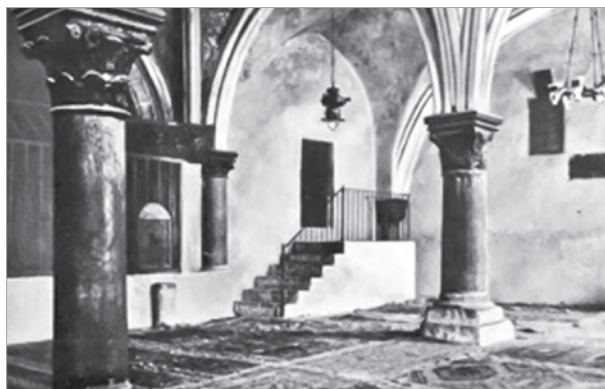
Горница Тайной вечери

К 1920-м годам перечисленные аспекты внешнеполитической повестки были дополнены еврейско-сионистскими вопросами, ставшими особо актуальными на фоне Декларации Бальфура от 1917 года о доброжелательном отношении Великобритании к стремлениям евреев обосноваться в Палестине. В связи с этим МИД Италии считал целесообразным подключить потенциал итальянских евреев к