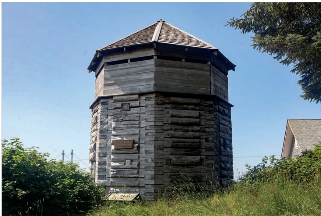
Блокгауз времен Русской Америки