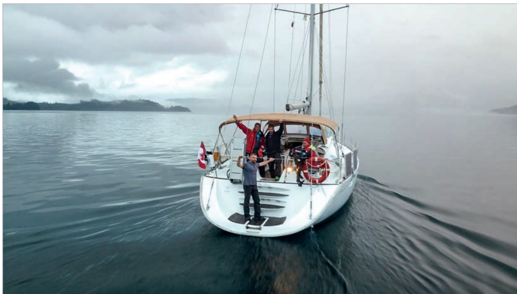
Экспедиция 2019 года обследовала на яхте места бывших крепостей Русской Америки

переносы, или волоки, из одного района в другой с использованием рек, озер, ручьев, участков суши. Каждый такой маршрут обычно включал подъем против течения, прохождение волоком водораздела (перевала), спуск по течению. Таким образом, сокращалось время доставки пушнины, почты и припасов по сравнению с доставкой по морю.