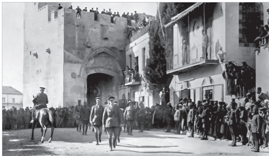
Эдмунд Алленби вступает в Иерусалим. 11.12.1917

работе по защите интересов страны в этом Ближневосточном регионе, чтобы, ко всему прочему, противодействовать растущему там британскому влиянию 3 .