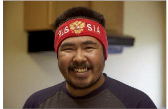
Жители бывшей Русской Америки до сих пор питают добрые чувства к русским колонистам