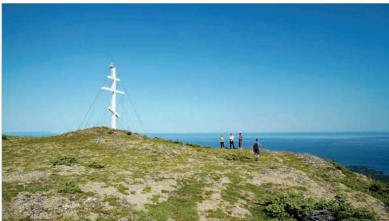
Крест на горе Германа на острове Еловый

изменений условий переносов в сравнении с историческими данными. В ходе экспериментов выяснилось, что транспортные возможности переносов очень сильно зависели от природно-климатических условий данного региона. По результатам экспедиций создан электронный атлас переносов Русской Америки, дающий представление о специфике использования русскими промышленниками и миссионерами переносов (волоков) в Русской Америке и визуализирующий современное состояние волоков.