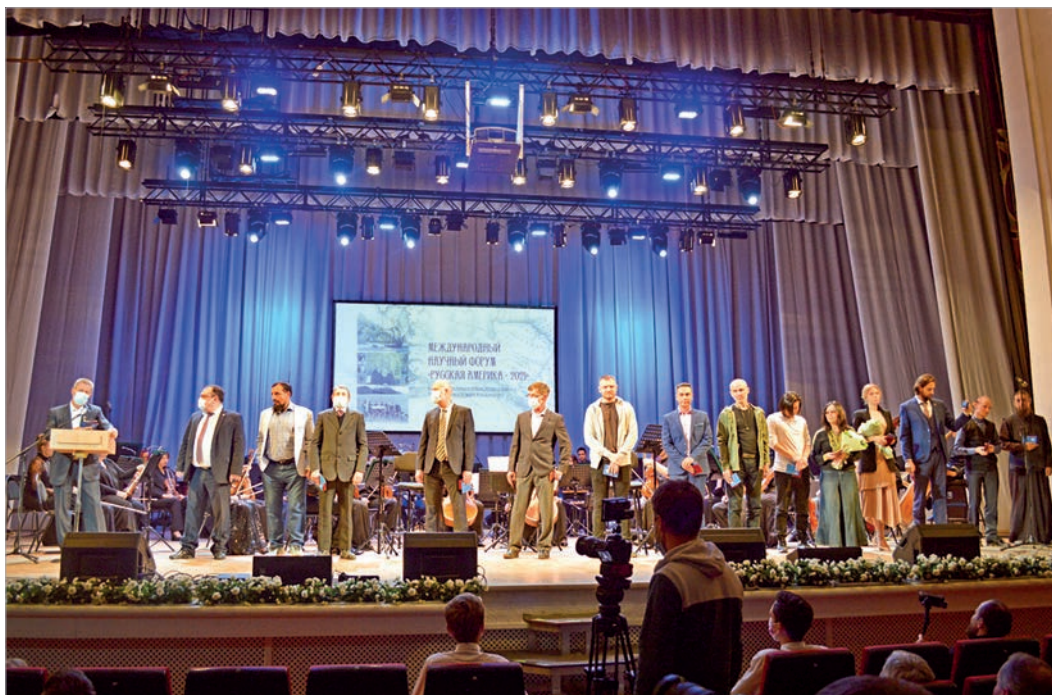
Открытие форума «Русская Америка - 2021» 7 сентября 2021 г.

тов, собранных во время экспедиций на Аляску, а также внушительный массив экспедиционных фото- и видеоматериалов. Музей провел несколько десятков выставок в Рязанской области, Самаре, Бузулуке, Оренбурге, Ульяновске, Пензе, Ярославле, Калуге, Туле, в Москве и Петербурге.