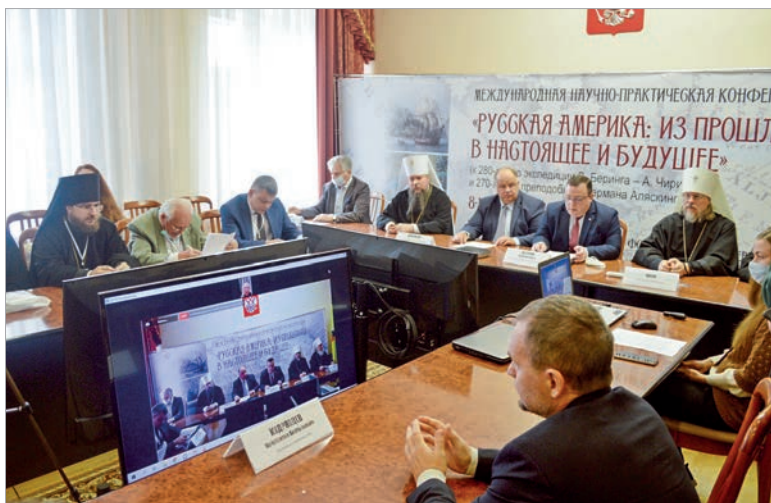
Пленарное заседание научно-практической конференции «Русская Америка: из прошлого в настоящее и будущее», РГУ им. С.А.Есенина, 8 сентября 2021 г.

Таким образом, Рязань по праву заслужила роль «столицы» мемориальных мероприятий 2021 года,