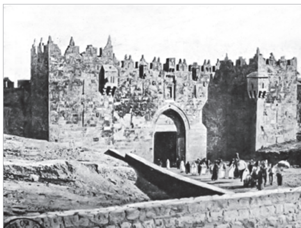
Дамасские ворота. 1933 г.