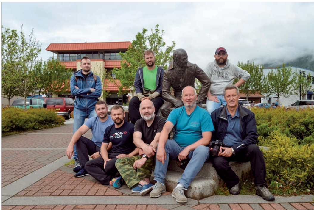
Участники экспедиции РГО у памятника Александру Баранову в Ситке, 2019 г.

Впервые мы провели натурные исследования на месте высадки членов команды первооткрывателя Аляски А.Чирикова в 1741 году. Точно повторен маршрут его движения с аналогичными наблюдениями местности и пеленгами. Предварительный анализ полученных данных говорит о том, что высадка состоялась совершенно в другом месте, нежели принято считать в классической истории, и сразу стало понятно, что первые европейцы увидели Аляску гораздо севернее.