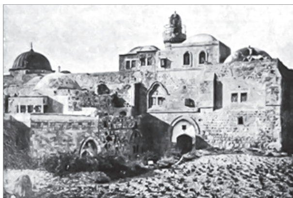
Здание Сенакля. 1930 г.