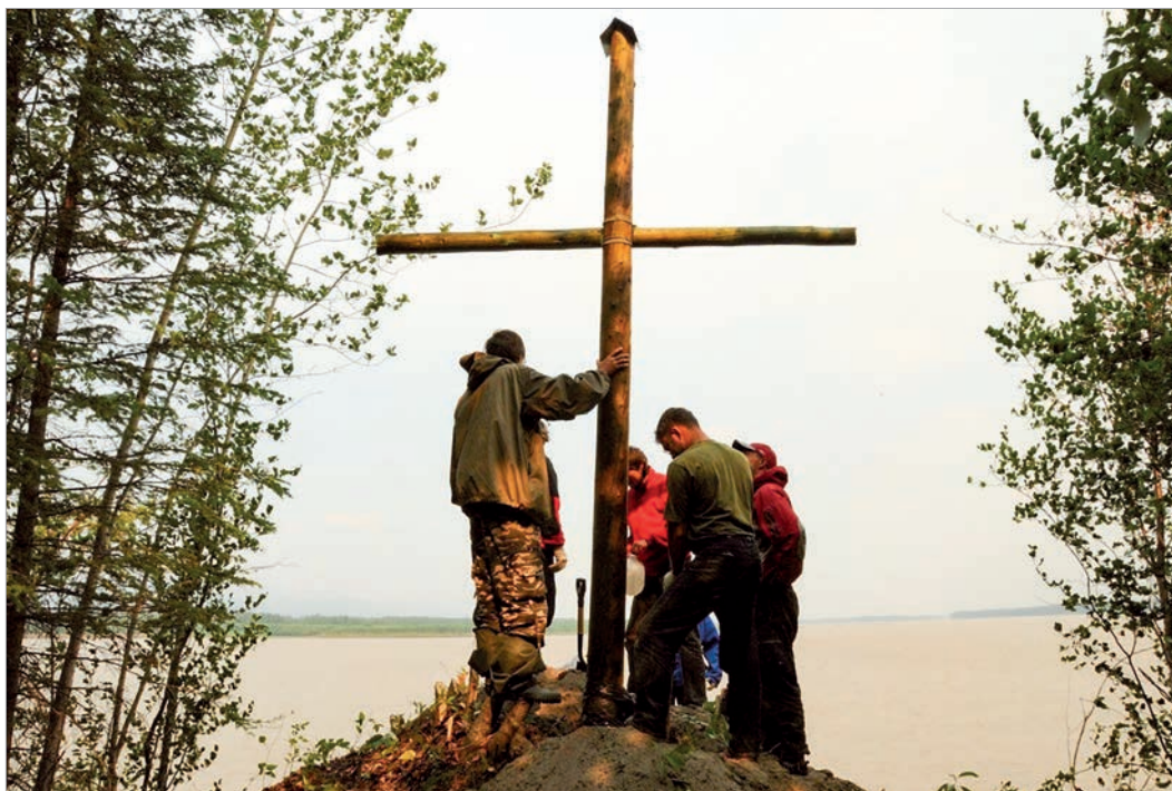
Крест в местечке Кросс-Пойнт - самой дальней точке на реке Юкон, которой достиг Загоскин, двигаясь вглубь Аляски

До сих пор самая распространенная конфессия на Аляске - православная. Мы посетили более 40 храмов в Русской Америке и везде видели иконы с ликом первого православного святого на северо-американской земле - преподобного Германа Аляскинского, который прибыл в те далекие края в конце XVIII века из городка Кадом, находящегося ныне на территории Рязанской области.