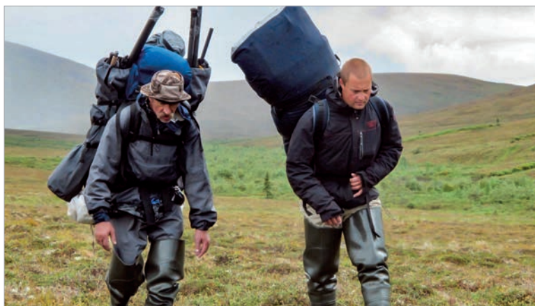
Преодоление перевала на переносе Кускоквим - Юкон