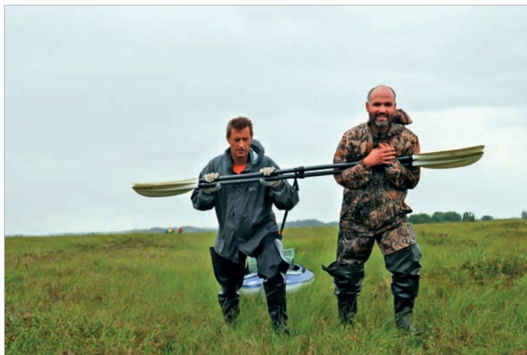
Исследование переноса (волока) с реки Кускоквим на реку Юкон, использовавшегося русскими промышленниками

Экспедиция 2017 года выполнила исследование переноса из Диллингема в Аниак и подвела итоги наших экспедиций 2010-2017 годов по исследованию волоков во внутренних районах Аляски. Мы повторяли и изучали современное состояние маршрутов, описанных пионерами Русской Америки лейтенантом Загоскиным, штурманом Васильевым и другими. Во времена Русской Америки промышленники активно использовали так называемые «портеджи» -