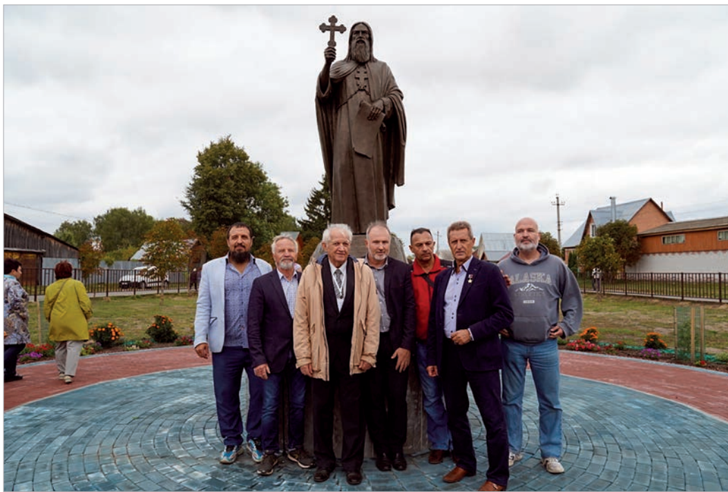
Участники форума «Русская Америка - 2021» у только что открытого памятника преподобному Герману Аляскинскому в поселке Кадом, 10 сентября 2021 г.