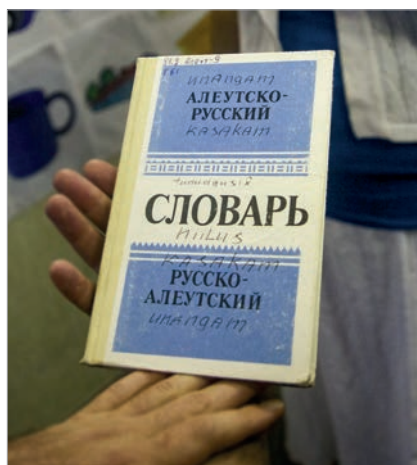
Подарок библиотеке школы поселка Атка из российского поселка Никольский, что на острове Беринга (Командорские острова)

Остатки старых русских построек есть и в других местах. Большая удача ожидала нас во время сплава по реке Холитне и ее притокам. Мы остановились в местечке, которое сейчас носит название Мейлинг Трейдинг Пост. Тамошние аборигены показали пространство, где когда-то проводились раскопки на месте стоявшей здесь русской избы. Добравшись до этого высокого холма и осмотрев конфигурацию раскопок, мы поняли, что это похоже на русскую избу-пятистенку. Скорее всего, имен-