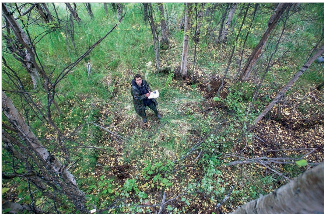
Место расположения блокгауза в рудте Колмакова на реке Кускоквим