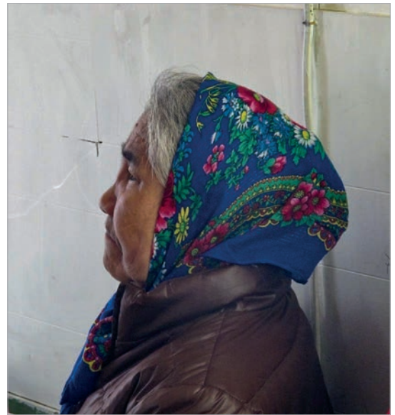
Бабушки на Аляске носят платки на русский манер