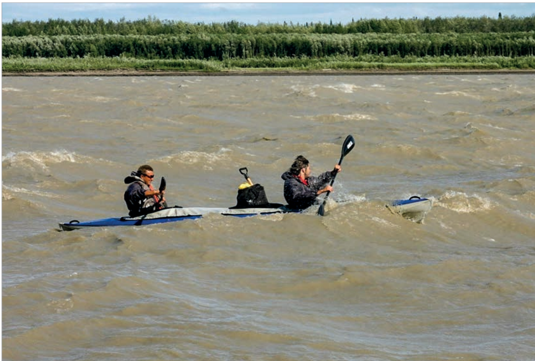
Суровые воды Юкона стали испытанием для участников экспедиции

Мы добрались до местечка Кросс Пойнт - это самая дальняя точка на реке Юкон, которой достиг Загоскин, двигаясь вглубь Аляски. Здесь, на высоком берегу Юкона,