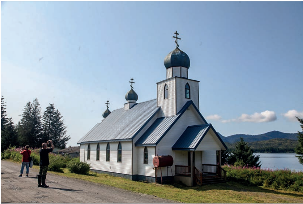
Православный храм в деревне Татитлек

название Борька, а другой остров называется Киска. На Кадыяке есть гавани Святого Павла и Святого Германа, бухта Russia Harbor (Русская Гавань), именно здесь в 1764 году проходила первая зимовка русских промышленников. Еще есть заливы Монашка, Бабий и Мельница. Первая же улица на Кадыяке, куда мы попали, выезжая из аэропорта, оказалась шоссе, носящее имя Резанова. Существуют также улицы, названные в честь других русских первопроходцев - Шелехова и Кашеварова.