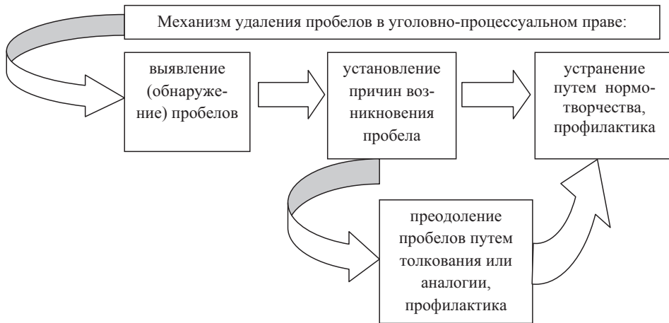
Рисунок. Механизм удаления пробелов в уголовно-процессуальном праве России

включает все вопросы, относящиеся к толкованию и применению Конвенции. Закономерным является вопрос о правовой природе решений ЕСПЧ – будут ли они источником уголовно-процессуального права. Решение Европейского суда по правам человека – «официально опубликованное решение, содержащее толкование общепризнанных принципов и международных норм о правах человека, Европейской конвенции о защите прав человека и основных свобод и Протоколов к ней, носящее общий характер и имеющее обязательную юридическую силу в уголовно-процессуальном праве Российской Федерации» 2 .