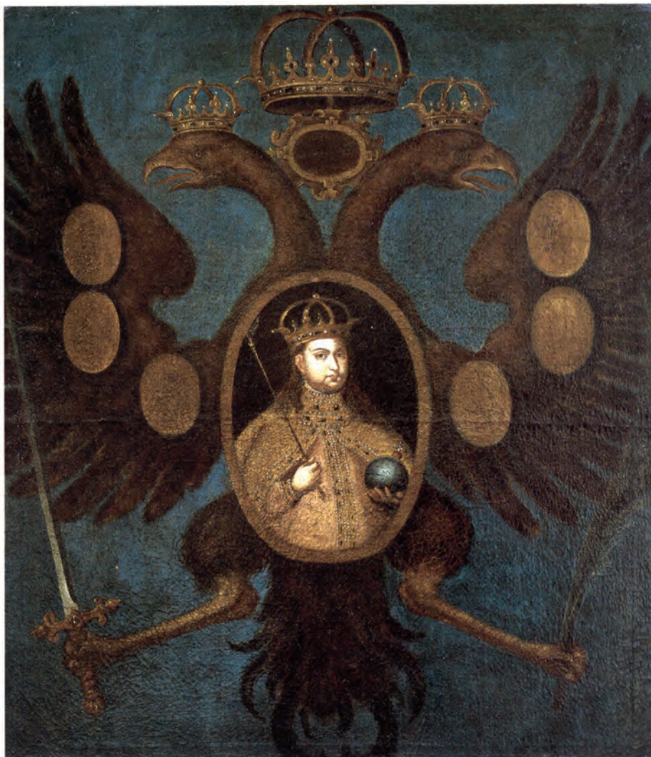
Илл. I. Софья Алексеевна. Портрет из Новодевичьего монастыря (холст, масло)