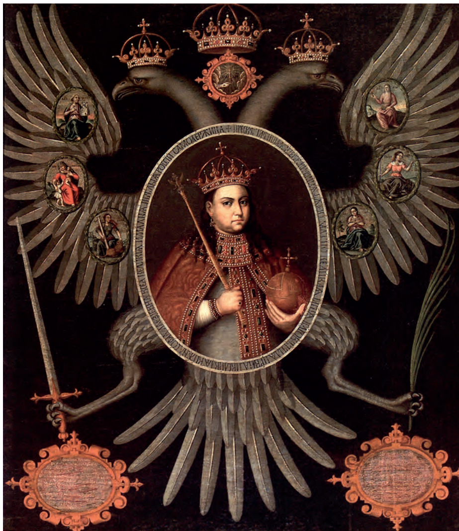
Илл. III. Софья Алексеевна. Портрет из Романовской галереи (холст, масло)