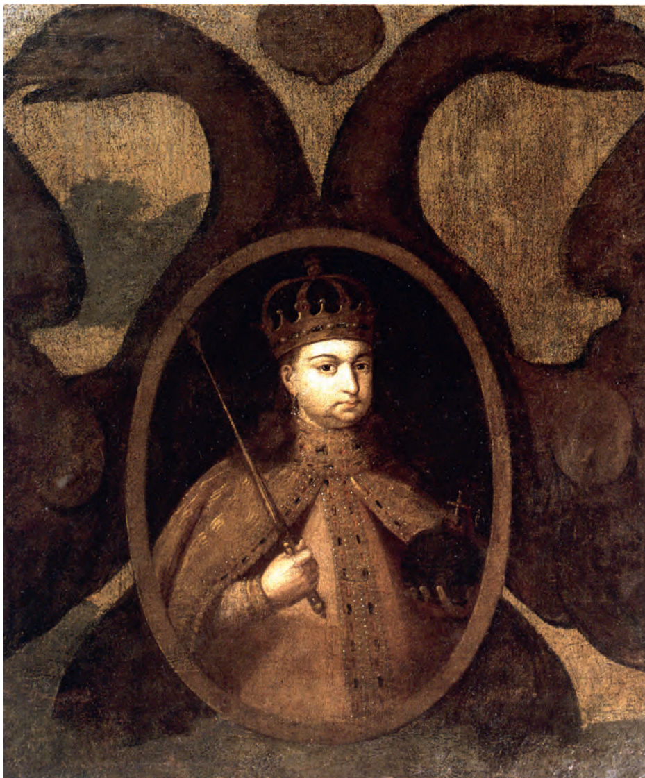
Илл. II. Софья Алексеевна. Портрет из Строгановского собрания (холст, масло)