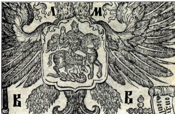
Илл. XI. Ездец (Библия. Москва, 1663 г.)