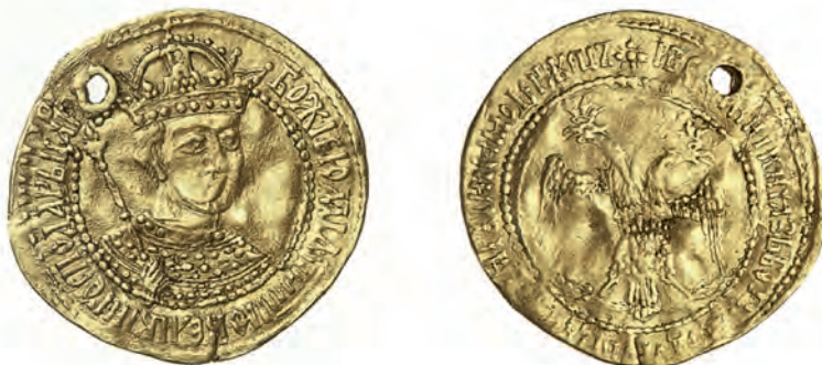
Илл. XIII. «Золотой» Бориса Годунова