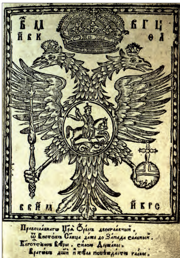
Илл. XII. Герб Российского государства ([Инокентий Гизель]. Синопсис. Киев, 1680)