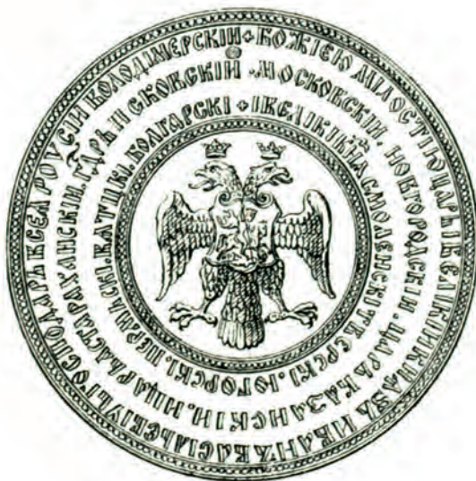
Илл. VIII. Большая государственная печать Ивана Грозного (1562 г.)