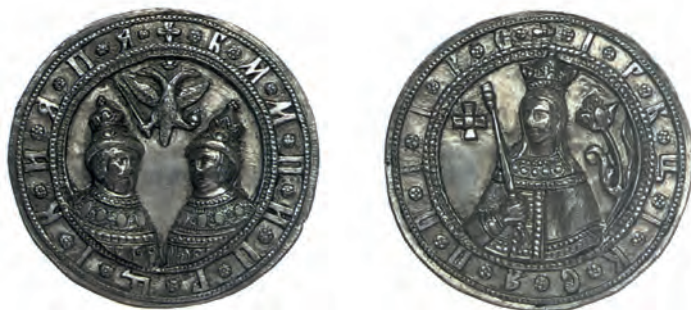
Илл. VII. «Золотой» Ивана и Петра Алексеевичей и Софьи Алексеевны (1687 г.)