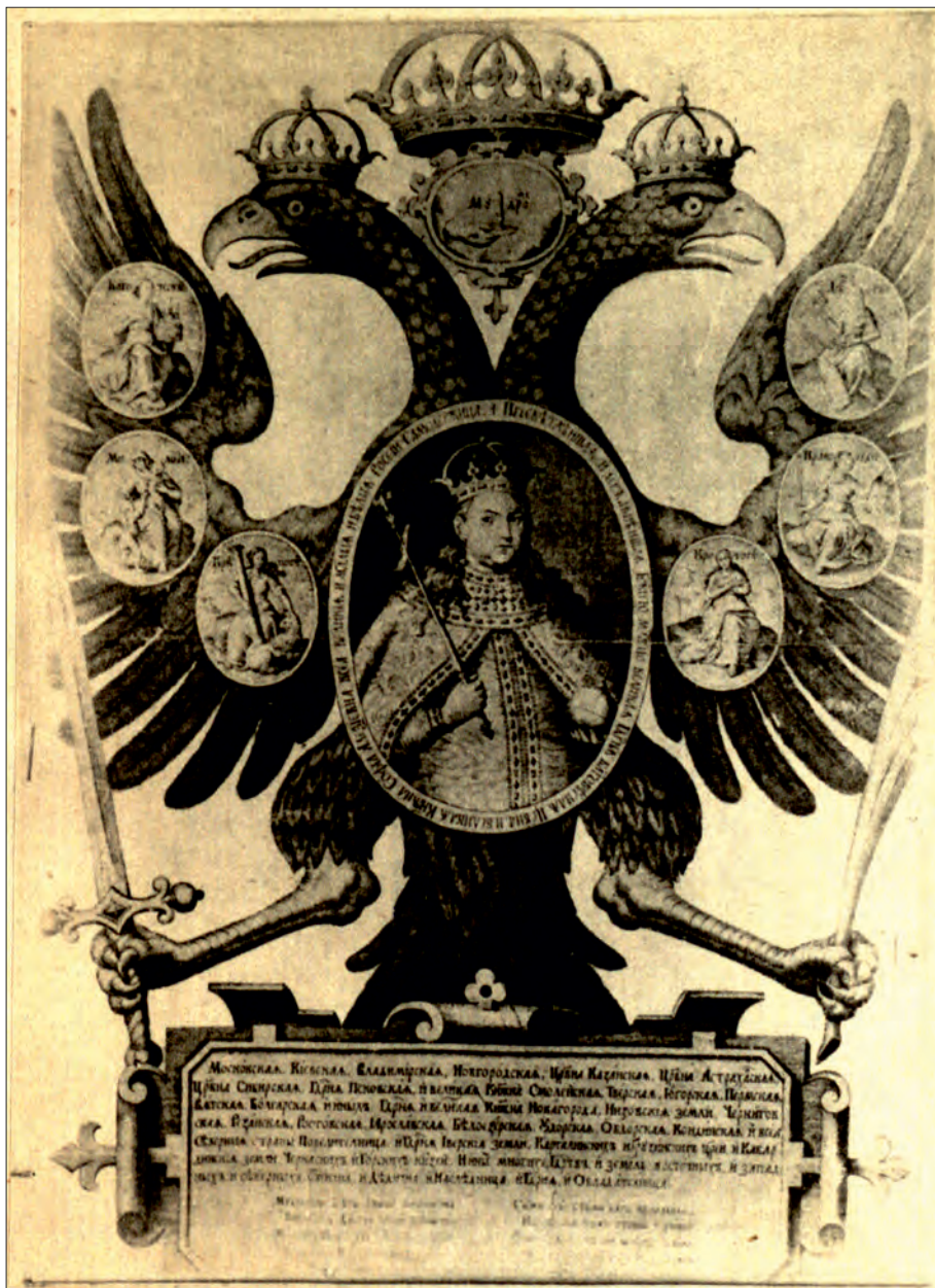
Илл. IV. Софья Алексеевна.