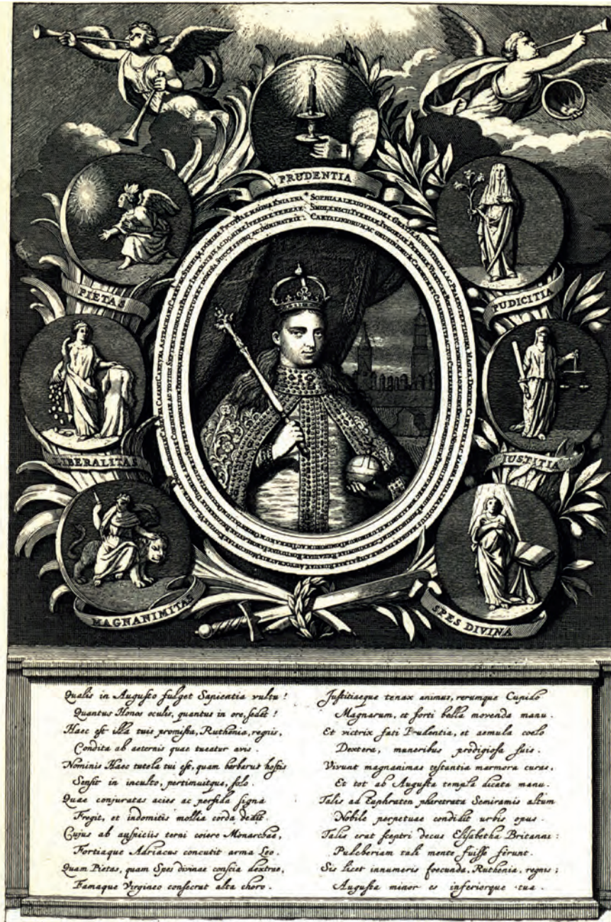
Илл. V. Софья Алексеевна. Гравюра А. Блотелинга