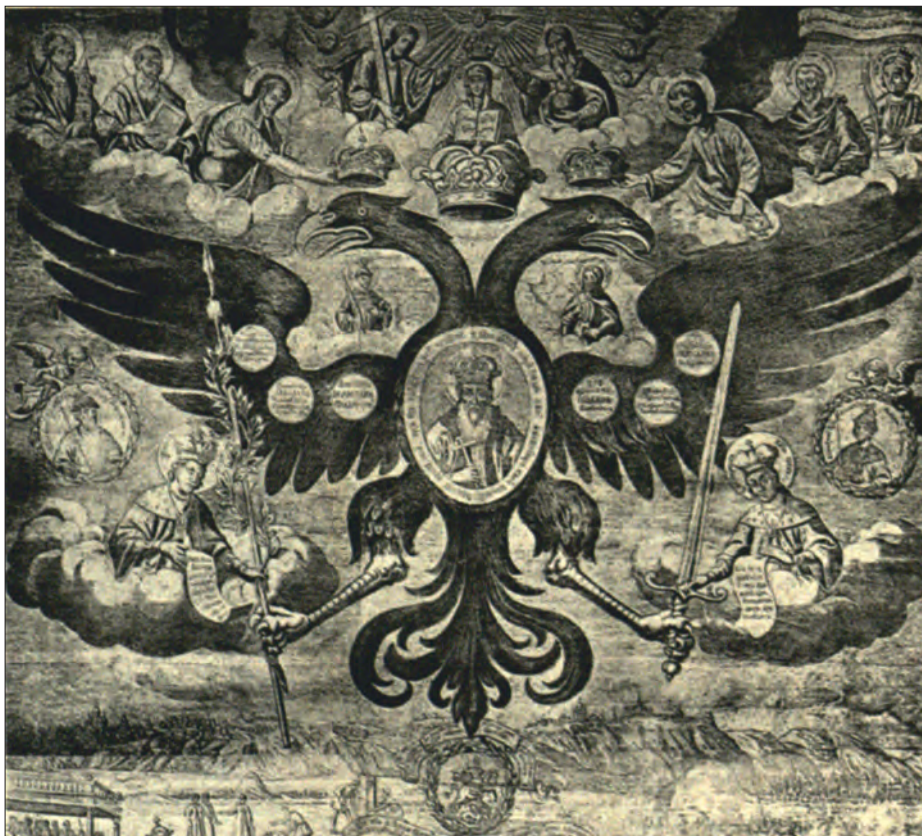
Илл. XV. Гнездо князя Владимира. Гравюра И. Щирского 1691 г. (фрагмент)