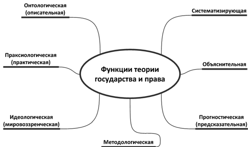
Интеллектуальная карта 01-02. Функции теории государства и права

Понятийный ряд категории «теория государства и права»