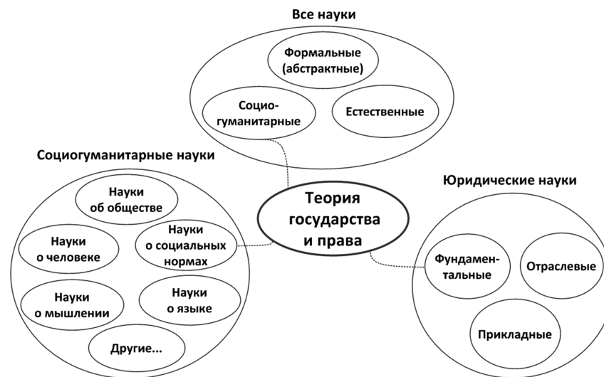
Интеллектуальная карта 01-04. Место теории государства и права в системе наук