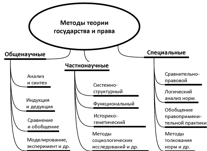
Интеллектуальная карта 01-03. Методы теории государства и права