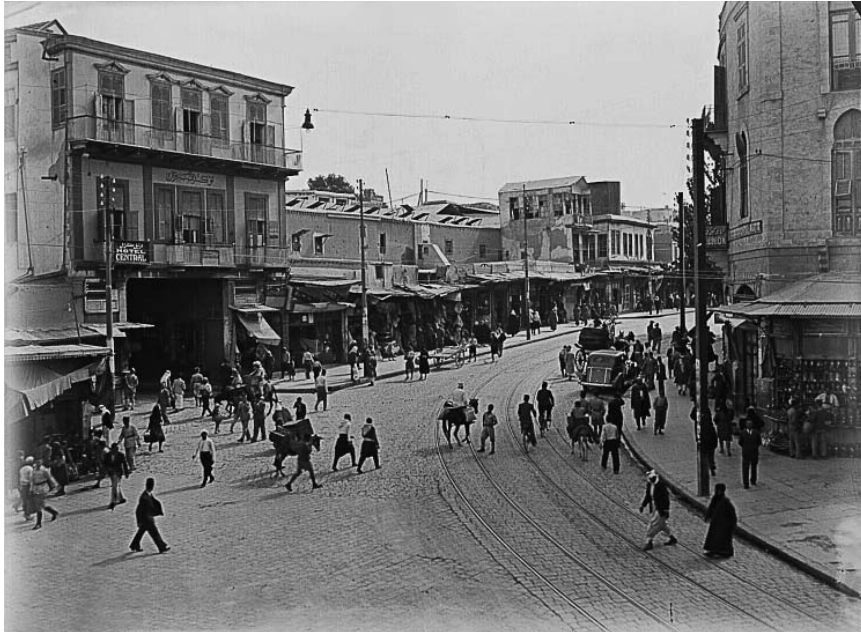
Перекресток улиц ад-Дарвишийя и Санджакдар (архив Ф. Нофала, 30-е гг. XX в.).

магрибинец же его оскорблял и поносил грубой бранью. Хозяин сада был храбрым человеком, он кинулся на магрибинца, отобрал у него оружие и связал, но испугался последствий этого дела, развязал его, отдал ему оружие и извинился перед ним. В магрибинце же возобладала низость – он схватил свое ружье, выстрелил в того и убил на месте. Появился брат хозяина сада, магрибинец выстрелил из пистолета, оказавшегося в его руке 1116 , и попытался бежать. Мужчины и женщины подняли крик, на который выскочил гулям. Он ударил магрибинца дубинкой и сбросил на землю. Магрибинца связали и доставили ал-хакиму, который постановил его казнить. На следующий день его задушили 1117 .