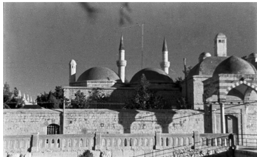
Сулейманская текийя (1936 г.).

1386 В ДР отмечено: <человек доброй репутации>.