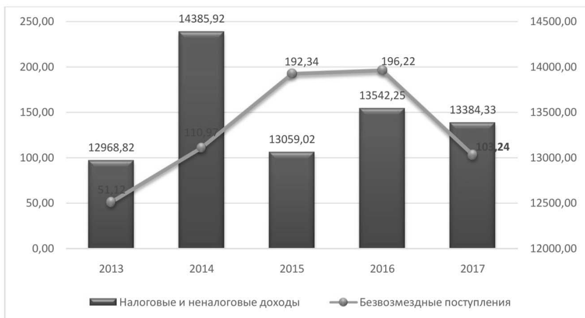
Рис. 1. Абсолютные значения общих доходов федерального бюджета за 2013 – 2017 гг., млн. руб.