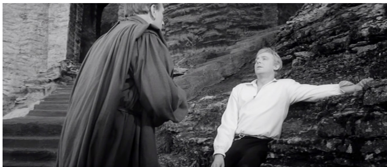
Пример 6. Кадр из фильма «Гамлет»

Одним из самых показательных фрагментов прорастания лирики является сцена дуэли Гамлета с Лаэртом (арт. С. Олексенко), основанная на своеобразном параде всех адских сил (динамическая реприза музыкальных тем Пролога), в котором участвуют тема Королевского двора, зловещие удары большого барабана, выстрелы, набат и словно несущаяся в демонической скачке тема Призрака. Поразительно, но она, сплетаясь с обрывками темы Двора, звучит торжествующе и победоносно, после чего, истощившая свою враждебность, успокаивается, сопровождая тихий уход Гамлета в небытие.