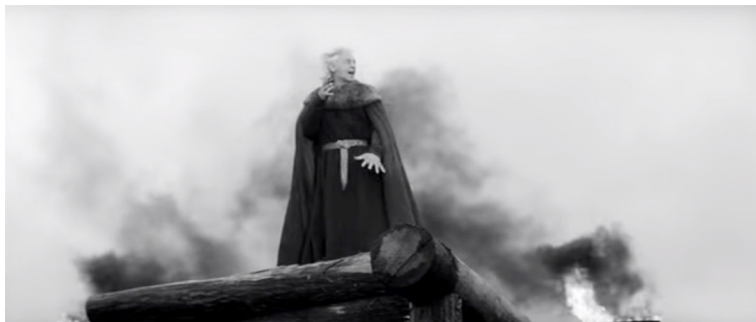
Пример 3 а. Кадр из фильма «Король Лир»

Наиболее рельефный эпизод, построенный на теме авторской рефлексии о судьбах Родины, — сцена после изгнания Корделии, когда в лейттему внедряются мотивы судьбы, грозных шагов, интонаций «автографа» Шостаковича, которые в сочетании с масштабной массовой сценой преклоненного перед королем народа воссоздает образ скорби планетарного значения. Здесь вновь за счет крещендирующего движения сдвоенных экспозиций (музыкальной и звукозрительной) происходит наращивание трагического смысла.