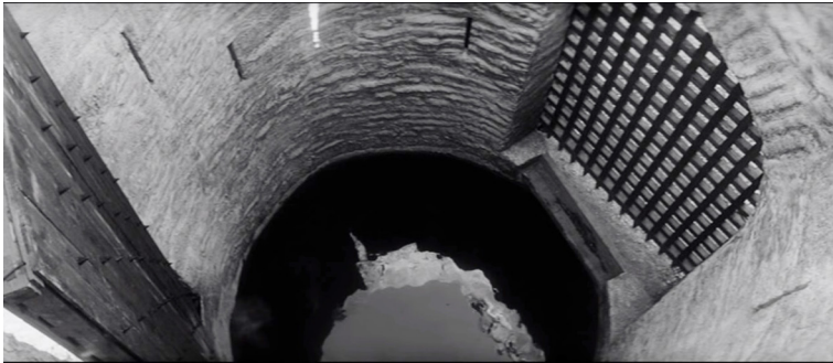
Example 1 b. Screenshot from film “Hamlet”

The musical exposition, permeated with Shostakovich’s monogram theme opens up a broad-scale panorama of the approaching of catastrophe and grief, which is based on the interaction of the grim and the lyrical themes: