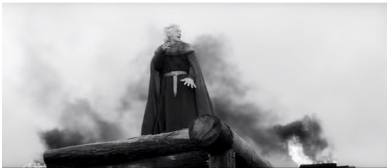
Example 3 a. Screenshot from film "King Lear"

The most relief episode built on the theme of the composer's reflections on the fate of his native country is the scene after Cordelia's banishment, when the leit-theme becomes infiltrated with motives of fate, menacing footsteps, the intonations of Shostakovich's "autograph," which in combination with the immense mass scene of the people bowing to the king recreates the image of sorrow of a planetary sense. Here, once again, the crescendo motion of the double expositions (the musical and the sonic-visual) results in the accumulation of tragic semantical meaning.