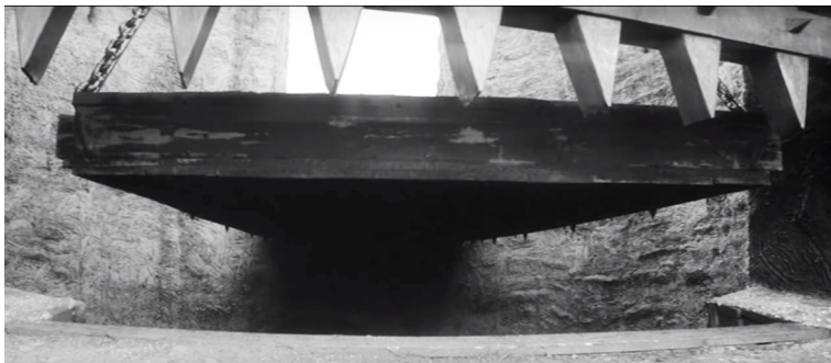
Example 1 a, Screenshot from film “Hamlet”

Shostakovich's monogram theme permeates the leitmotif system in his music to both films and creates an emotional psychological contrast to their visual element. In “Hamlet” the visual exposition of the image of the Elsinore castle is assembled from a deserted rocky sea landscape, a burning torch against the background of a stone wall of a gloomy medieval castle, lowered funeral flags, a precipitate galloping of horsemen speeding to the place where the tragedy occurred, a massive drawing-bridge serving as the gates of the castle, and the bars descending menacingly, with sharp battlements tightly closing off communication with the outer world. And towards the end we can also see a deep moat with black water, from where there is no rescue.