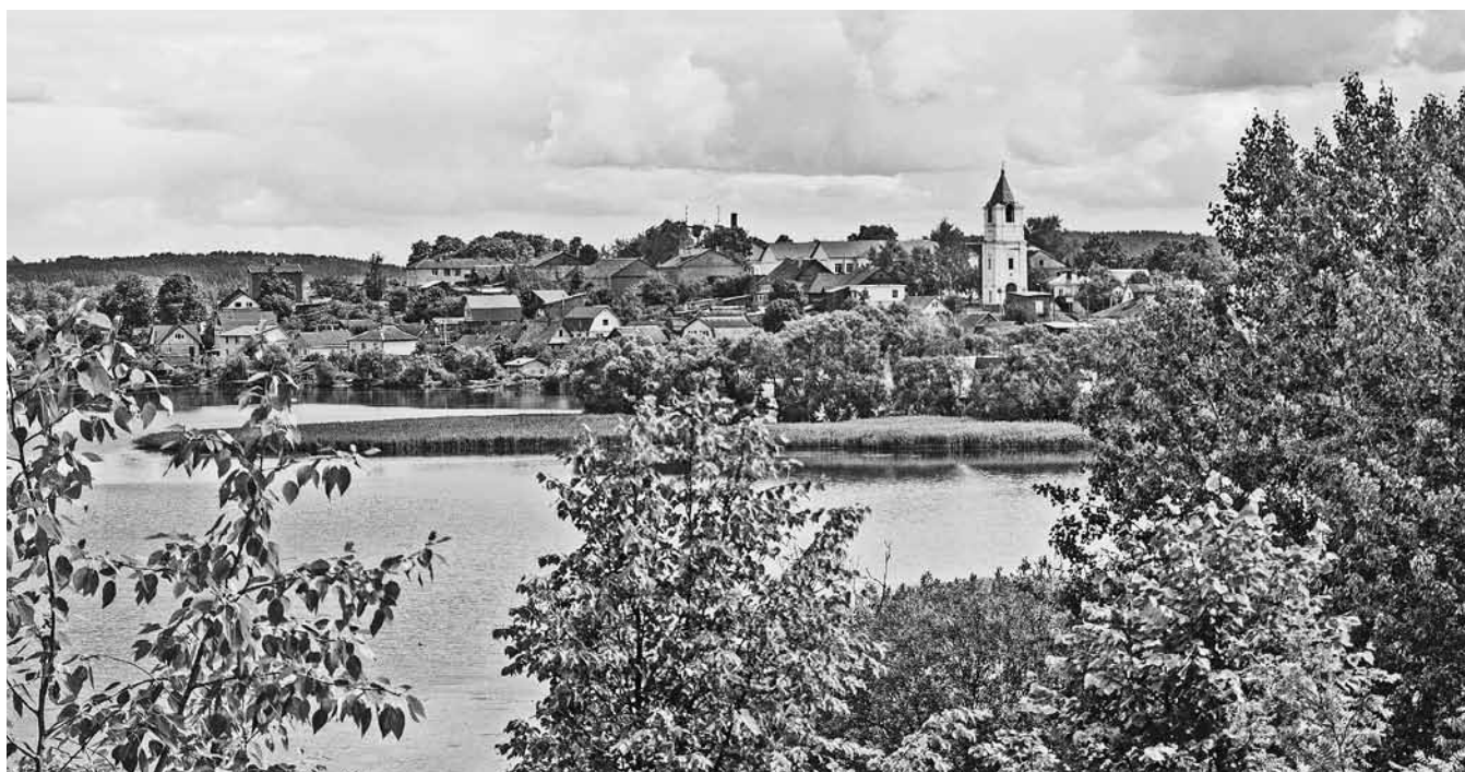
Вид на Замковую гору с Петровской горы. Себеж.

3. [И что делают после ЗАГСа молодые?] Ну, вот они едут кататься, могут ехать куда-то. Ну кто их знает, куда они там поедут. У нас тут в Себеже могут туда на озеро, туда дальше, за [реку] Угоринку, там... <...> Кругом озёра у нас. Так вот они туда едут кататься. Могут выйти, там где-то на озере постоять. Сфотографируются, покатаются сразу частью, то под ресторан... то два часа могут кататься. <...> Перегораживали дорогу, да, да-да-да. И нам перегораживали дорогу, и Танечке [дочери] перегораживали. [Как перегораживали?] А люди верёвку натягивают. Встанет вдвоём: один на одной стороне дороги, второй — на другой. Держат верёвку, не проехать. Ну вот встаёшь тогда, и выкуп свой носи... возили. Водку, конфеты там, в общем, вино. Ну порядочно надо было. А то жених... А когда жених ехал за невестой, ему тоже дорогу преграждали. [Да?] Да, он давал выкуп за невесту. То ли водки, хочешь — деньгами? А нет, он должен был деньгами. [Деньгами обязательно?] Да, вот так. [По дороге, возле дома или где ловили его?] А где поймают. Где... так его ж специально и караулят,