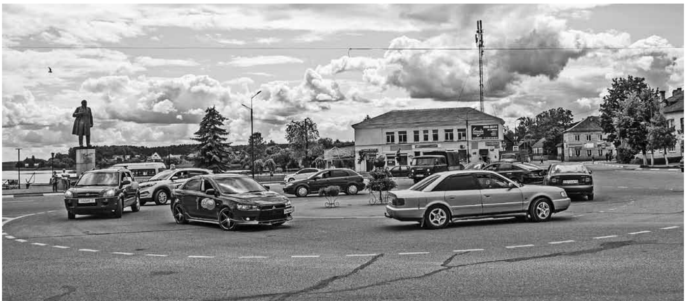
Объезд по кругу площади Ленина свадебным кортежем. Себеж.

7. [Не смотрели как-то ещё, кто будет в доме главным? Может, кто первый в дом зайдёт?] Вот это я не помню. Я помню, что у дочки когда была свадьба, они в тувель это шампанское наливали и пили. Потом тувель через себя кидали — кто дальше кинет. Вот это было. Ой, эти, бокалы били на счастье. Вот... [Это жених и невеста кидали?] Да. <...> [А кто дальше кинет, что по