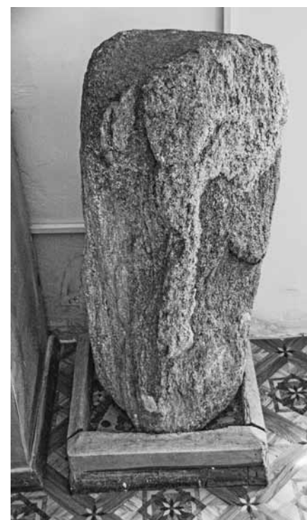
Идол Пестун. Себежский краеведческий музей.