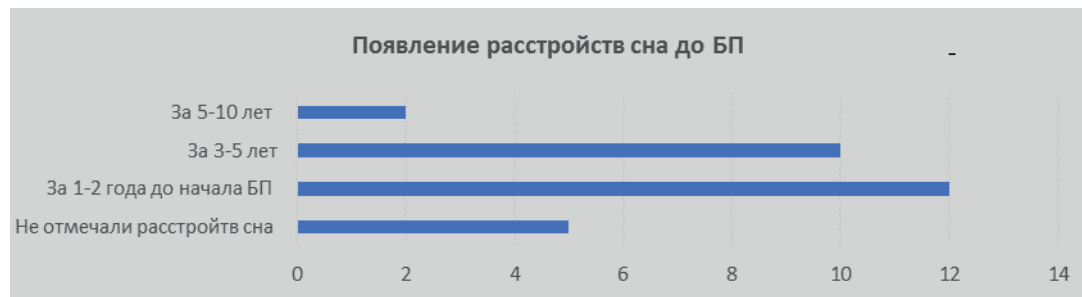
Рис. 4. Реакция на диагноз болезни Паркинсона (n=29).

До включения в настоящее исследование расстройства сна были диагностированы у 5 (17.2%) пациентов, терапию по поводу расстройств сна принимали только 2 (6.8%). Столь низкие по-