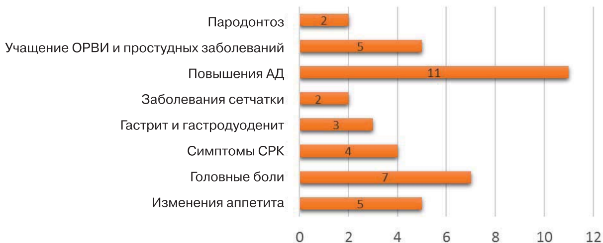
Рис. 1. Распространенность соматических симптомов в рамках депрессивных фаз у пациентов в дебюте болезни Паркинсона (n=29).

начало первого эпизода аффективной симптоматики ( 59 \pm 13,6 года). Депрессия в продроме БП носила эндореактивный характер и отличалась большой выраженностью тревожных черт: ипохондрическая тревога имела место у 22 (75.8%), моральная ипохондрия (тревога за когнитивные способности) – у 27.5%), тревога по поводу симптомов БП – у 10 (34.4%), тревога по поводу общего состояния здоровья – у 4 (13.7%), панические атаки – у 5 (17.2%) пациентов. Для многих пациентов – n=16 (55.1%) были характерны чувство собственной измененности, неуверенность в когнитивных функциях, потребность в поддержке близкими, неуверенность в выполнении повседневных действий, что чаще всего выступало главной причиной увольнения с работы и сужению круга деятельности задолго до манифестации первых моторных симптомов.