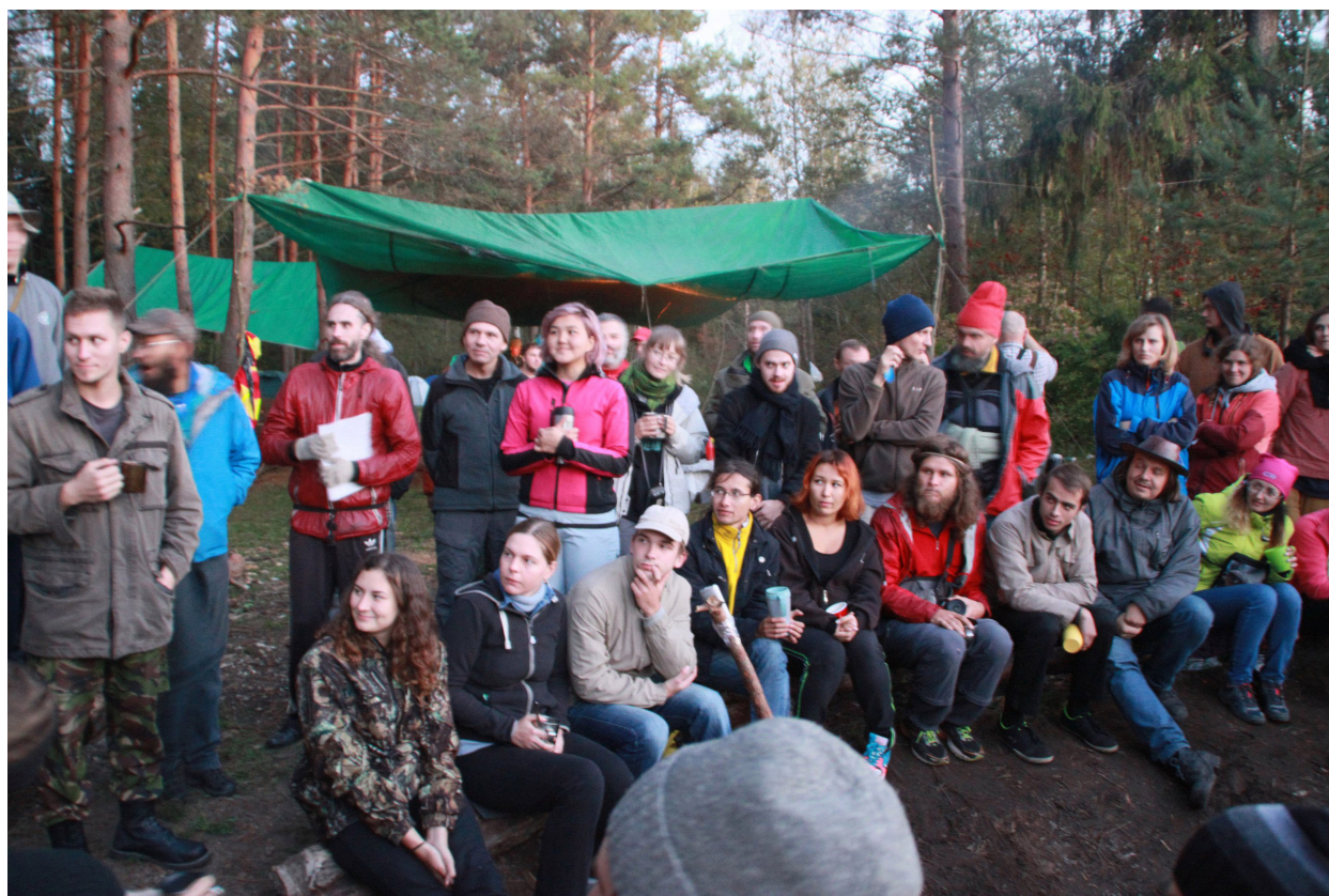
Рисунок 3. Сообщество вольных путешественников на слёте Академии Вольных Путешествий в Подмоскowie осенью 2017 года.

Респондент отмечает, что его путешествия соединились с музыкальным творчеством, и так он может писать музыку. Помимо этого он издаёт свои композиции о путешествиях, иначе они ему мешают жить дальше. «Вот, мы приезжаем в город... Для того, чтобы найти канал с публикой, для того, чтобы сыграть для этого города, нужно ходить по нему как минимум сутки... узнать его, познакомиться, подружиться...», «вот, ты получил информацию, это же не моё, это не я произвёл на свет... ты должен её отдать, потому что эта ёмкость, она должна быть всё время как бы... меняться... течение у неё должно быть...».