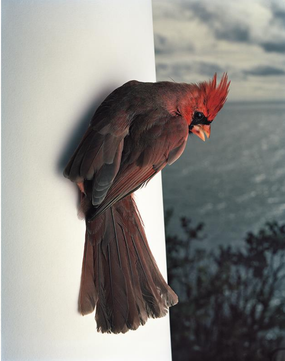
Фотография №1. The Nature of Imitation (2010-2014). Blue China, 2011.