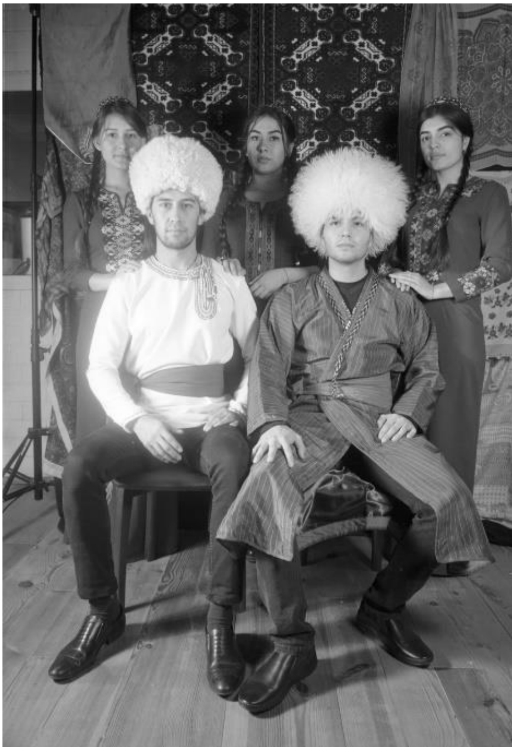
Фотография №3. Студенты в национальной одежде (туркмены). Астраханский государственный университет, 2018.