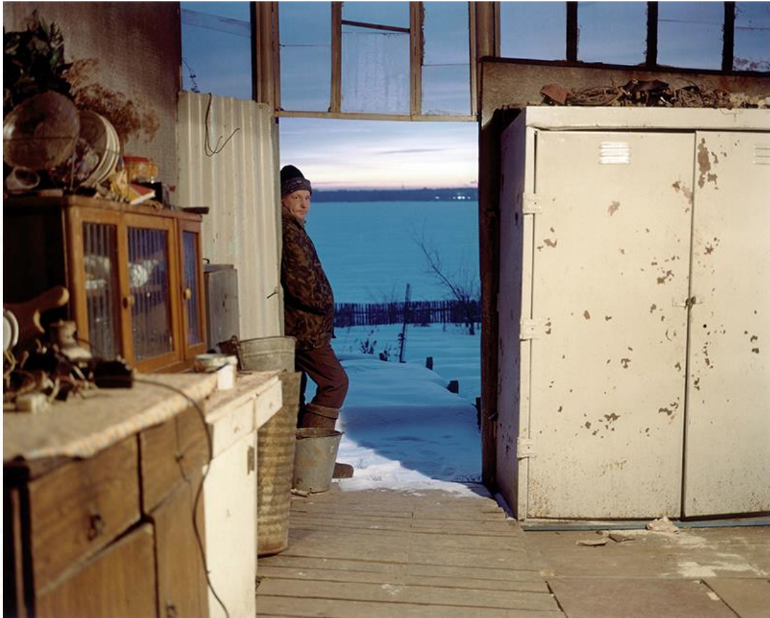
Фотография №2. Once Out of Nature: Travels through Russia (2003-2007). Ekaterinburg, 2003.