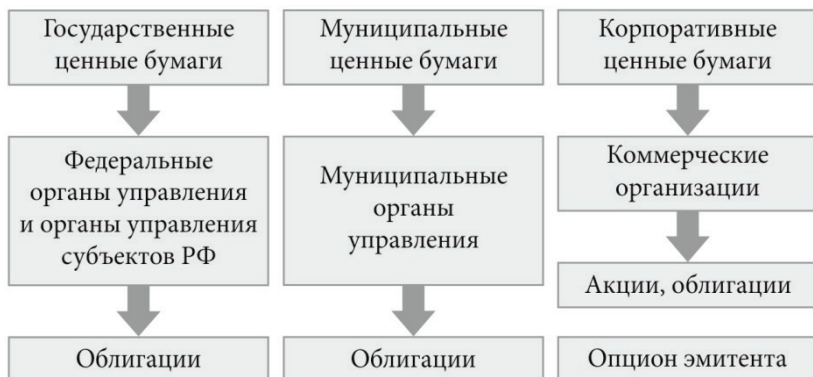
Рис. 3. Классификация эмиссионных ценных бумаг по эмитентам и видам

На рис. 3 представлена классификация эмиссионных ценных бумаг по эмитентам и видам.