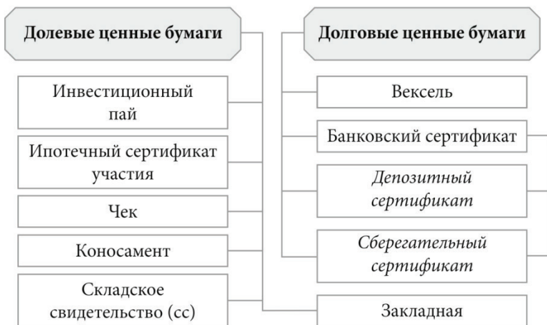
Рис. 2. Виды не эмиссионных ценных бумаг в Российской Федерации

Кроме эмиссионных ценных бумаг существуют и не эмиссионные ценные бумаги. Их классификация представлена на рис. 2.